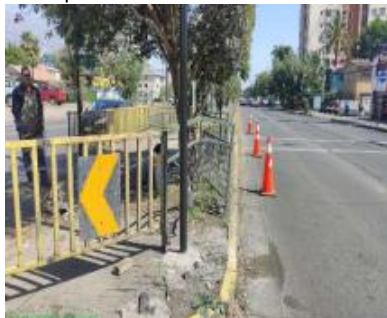
Limpieza de Cunetas, Soleras y Bajadas de Agua.