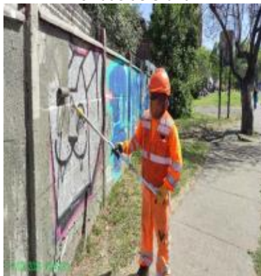
Reposición de Vallas Peatonales.