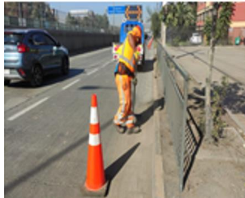
Limpeza de sumideros.