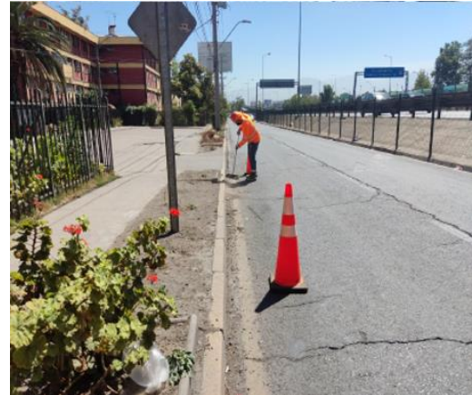
Limpeza de sumideros.