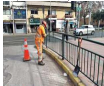
Limpieza de Cunetas y Soleras.

Se observan actividades de conservación de la infraestructura preexistente, realizada por la Sociedad Concesionaria (SC)