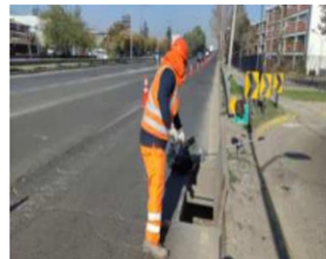
Limpieza de sumideros.