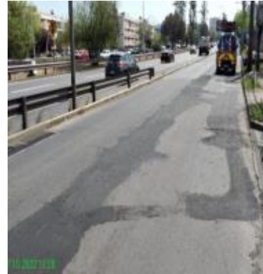
Actividades de Toma Posesión Material de lotes expropiados