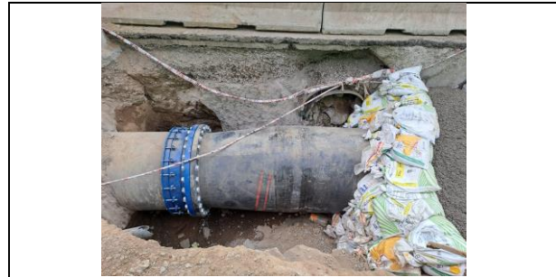
Armado matriz de agua potable nudo 10