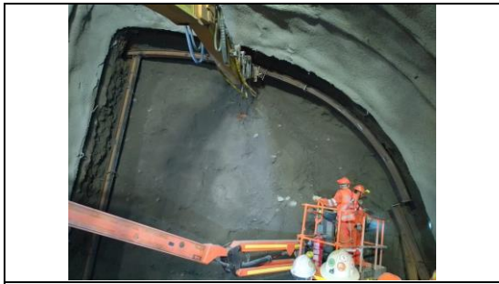
Obras Túnel Híbrido, colocación Marco 9