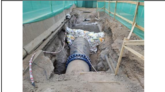
Conexión de agua potable Nudo 10 lado poniente.