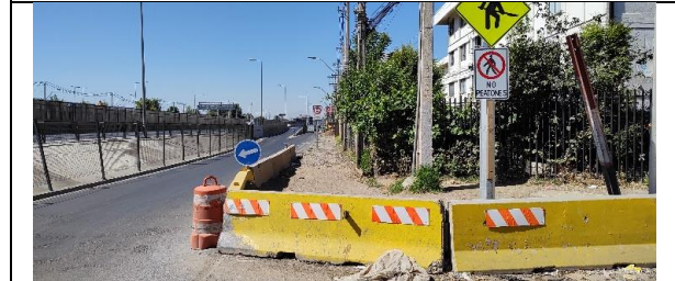
Desvío peatonal vía local poniente Av. Américo Vespucio