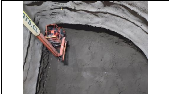
Obras Túnel Híbrido, trabajos de colocación de sello.