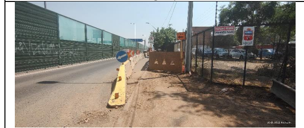
Desvío peatonal vía local oriente Av. Américo Vespucio