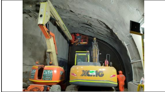
Obras Túnel Híbrido, trabajos de preparación para colocación de marcos