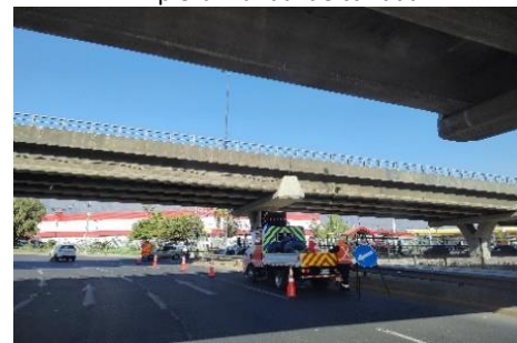
Trabajos de reparación de aceras