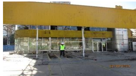
Limpieza manual de calzada