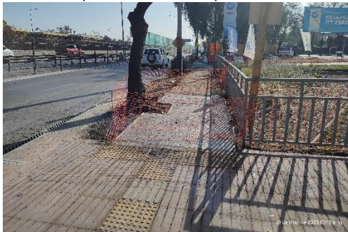
Circuito peatonal trabajos cambio de servicio