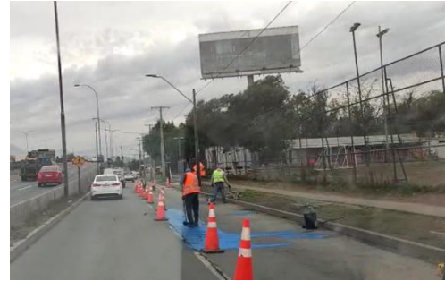
Reparación de aceras peatonales