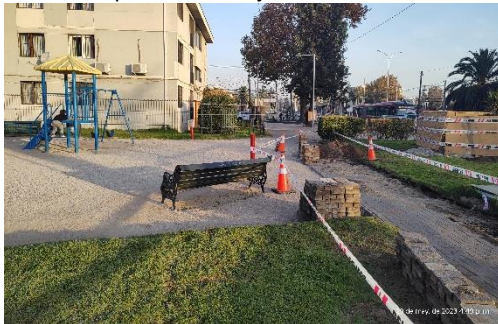
Reparación de pavimentos