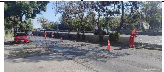
Labores de mantenimiento – Aseo de faja