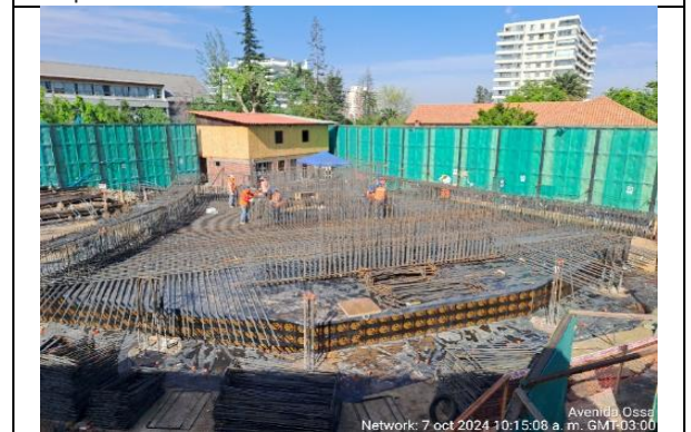
Frete 4, Vista de colocación de armadura de losa superior en Bifurcación de Ramal Salida Tobalaba