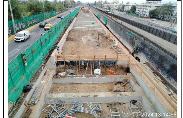
Frete 6, vista general sector B1 y parte del B2