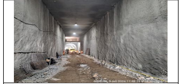
Frete 4, Vista general Trinchera cubierta del ramal STN .