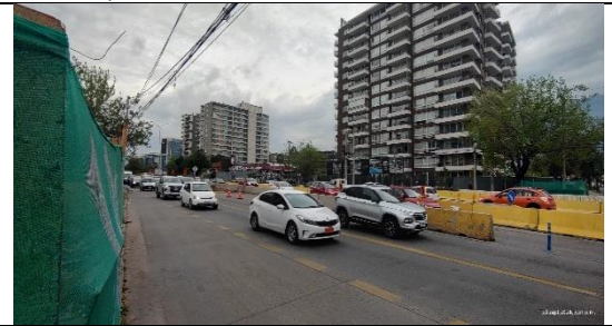
Desvío de tránsito sector N Laghi Rescate Arqueológico Fase 2