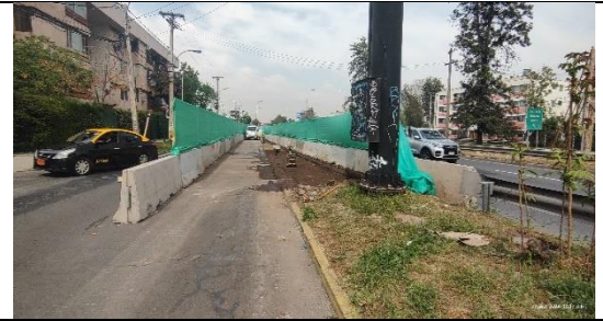
Preparación desvío Trinchera Los Orientales