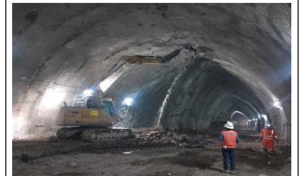
Trente 1, Vía Expresa Poniente, demolición de muro temporal en marco 133.