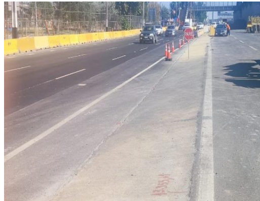
Desvío TEO, mejoramiento pista acceso