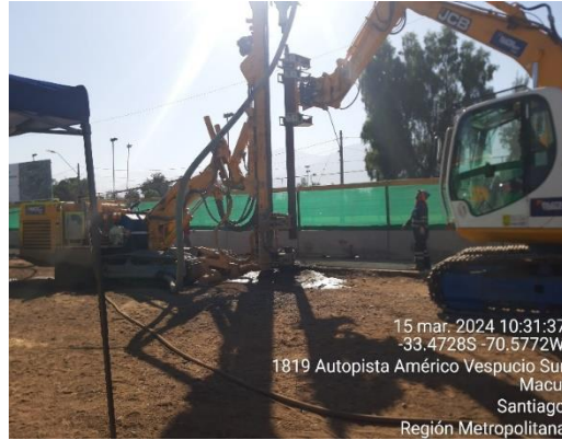
Inicio de trabajos de Micropilotes para proteger infraestructura de Metro