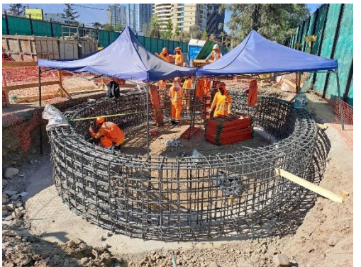
Brocal Pique de ventilación sector norte