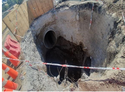
Cambio de Servicio, unión del bypass ejecutado al colector Grecia Quilín