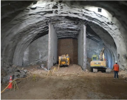
Túnel Híbrido excavación en Sección C con 3 fases