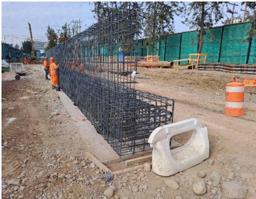
Viga de coronamiento lado izquierdo STN