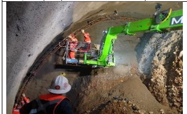
Túnel, Vía expresa poniente instalación de marco en fase 2