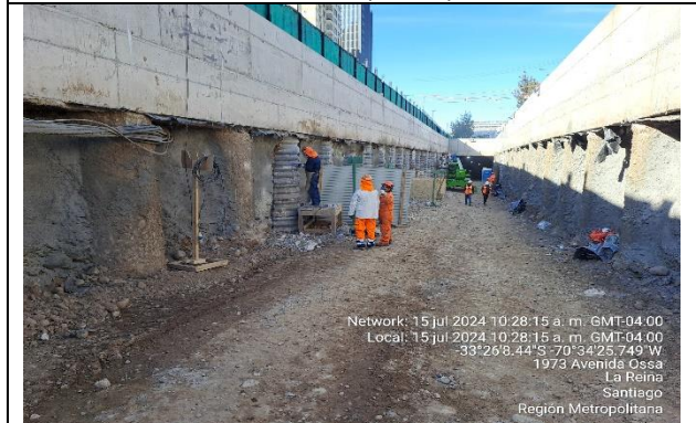
Ramal Salida Tobalaba Norte Pique sur profundidad 11,5m.

Network: 15 Jul 2024 10:28:15 a. m. GMT-04:00 Local: 15 Jul 2024 10:28:15 a. m. GMT-04:00 -33°26'8.44"S -70°34'25.749"W 1973 Avenida Ossa La Reina Santiago Región Metropolitana