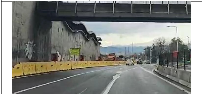
Desvío de tránsito TEO