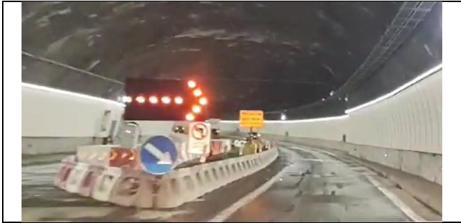
Desvío de tránsito ingreso a Túnel híbrido AVO I