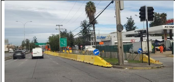
Desvío de tránsito Rescate Arqueológico A Vespucio/ E Castillo Velasco