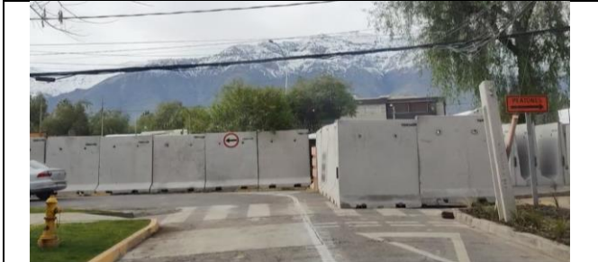
Desvío de tránsito hincado pilotes refuerzo en Caverna B. Gana