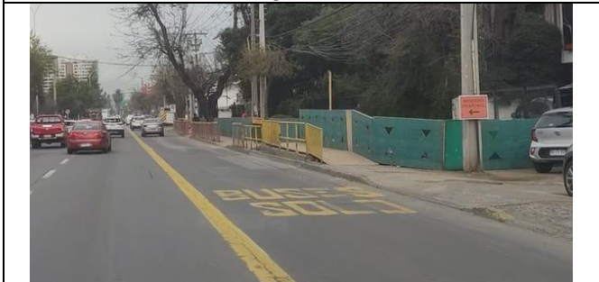
Circuito peatonal por CCSS Av. Ossa/Simón Bolívar