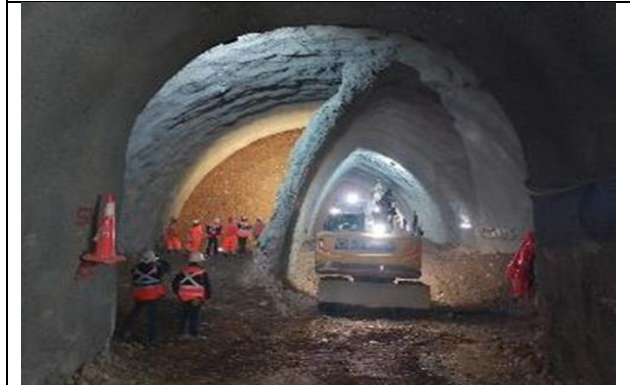
Túnel, Vía expresa poniente avance de frente 1 y 2