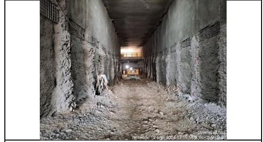
Vista general Trinchera cubierta del ramal STN .