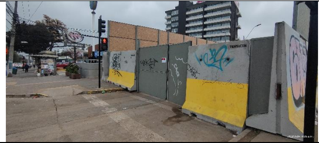
Desvío de tránsito refuerzo Caverna Blest Gana