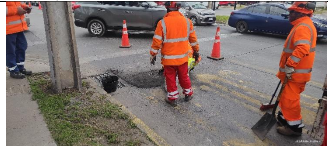
Mantenimiento pavimentos calzada poniente