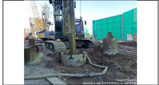
Excavación de pilote 61de Caverna de Ramal Blest Gana