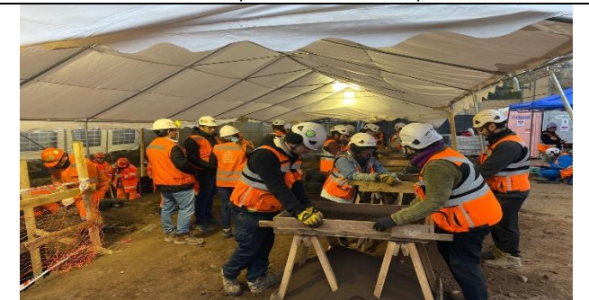
Rescate arqueológico sector plazas de bolsillo