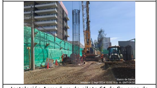
Instalación Armadura de pilote 61 de Caverna de Ramal Blest Gana