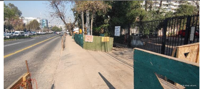
Circuito peatonal CCSS sector Simón Bolívar calzada poniente