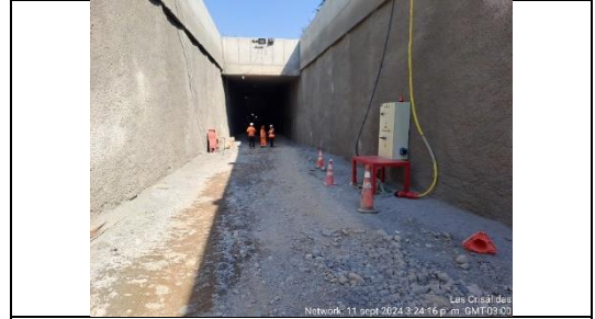
Ramal Salida Tobalaba norte