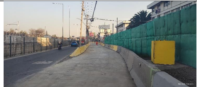
Preparación desvío de tránsito Colector SERVIU Fase 2