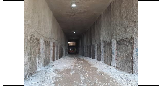
Construcción de muro forro Trinchera ramal STN.