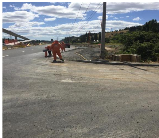
Ejecución de Obras Sector Pasarela El Membrillo, Dm 19.500, Sector A