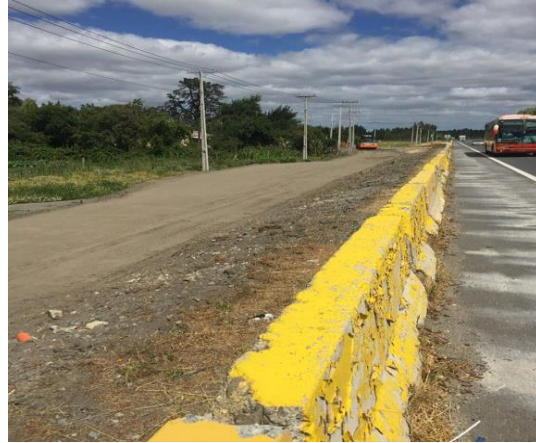
Ejecución de Fundaciones y Terraplén Pasarela Sector La Quinta, Dm 10.000, Sector A