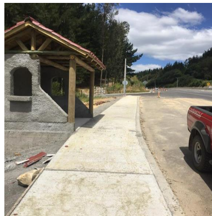
Ejecución de Obras Sector Pasarela San Antonio, Dm 55.370, Sector A