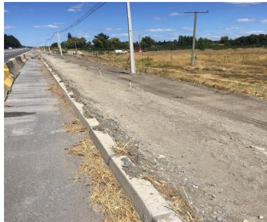
Fundaciones y Terraplén Pasarela Sector Puente Ibáñez, Dm 13.720, Sector A