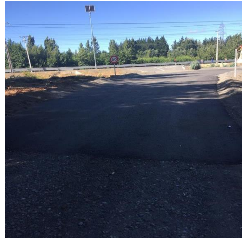
Ejecución de Obras Calle de Servicio Puentes Negros, Dm 12.000, Sector B