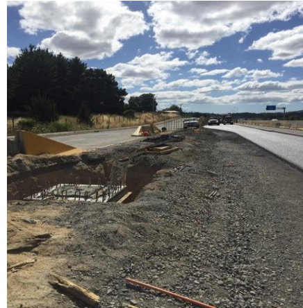
Ejecución de Obras Sector Pasarela Vega Larga, Dm 22.250, Sector A