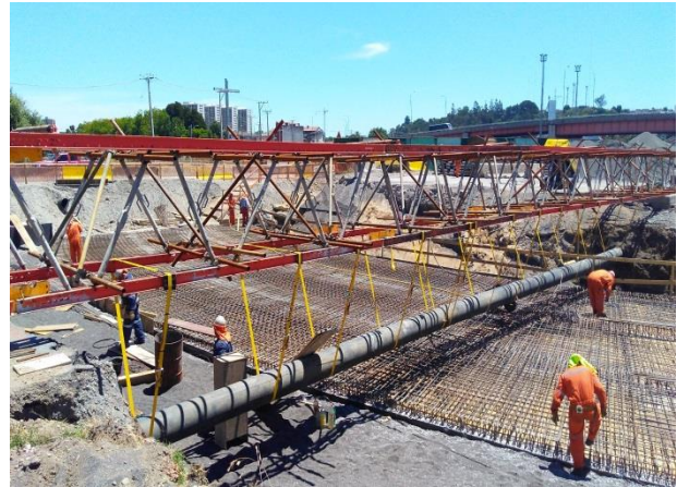
Obras de Desvío Canal Las Pocitas, Sector de Soterramiento Rotonda Bonilla