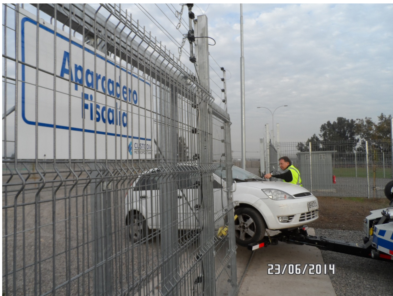
Ejercicio Marcha Blanca, acercamiento de vehículo a recinto intermedio