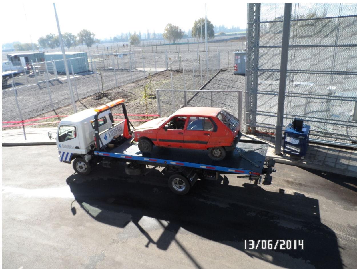
Pruebas etapa Marcha Blanca, ingreso de vehículo al recinto CMVRC