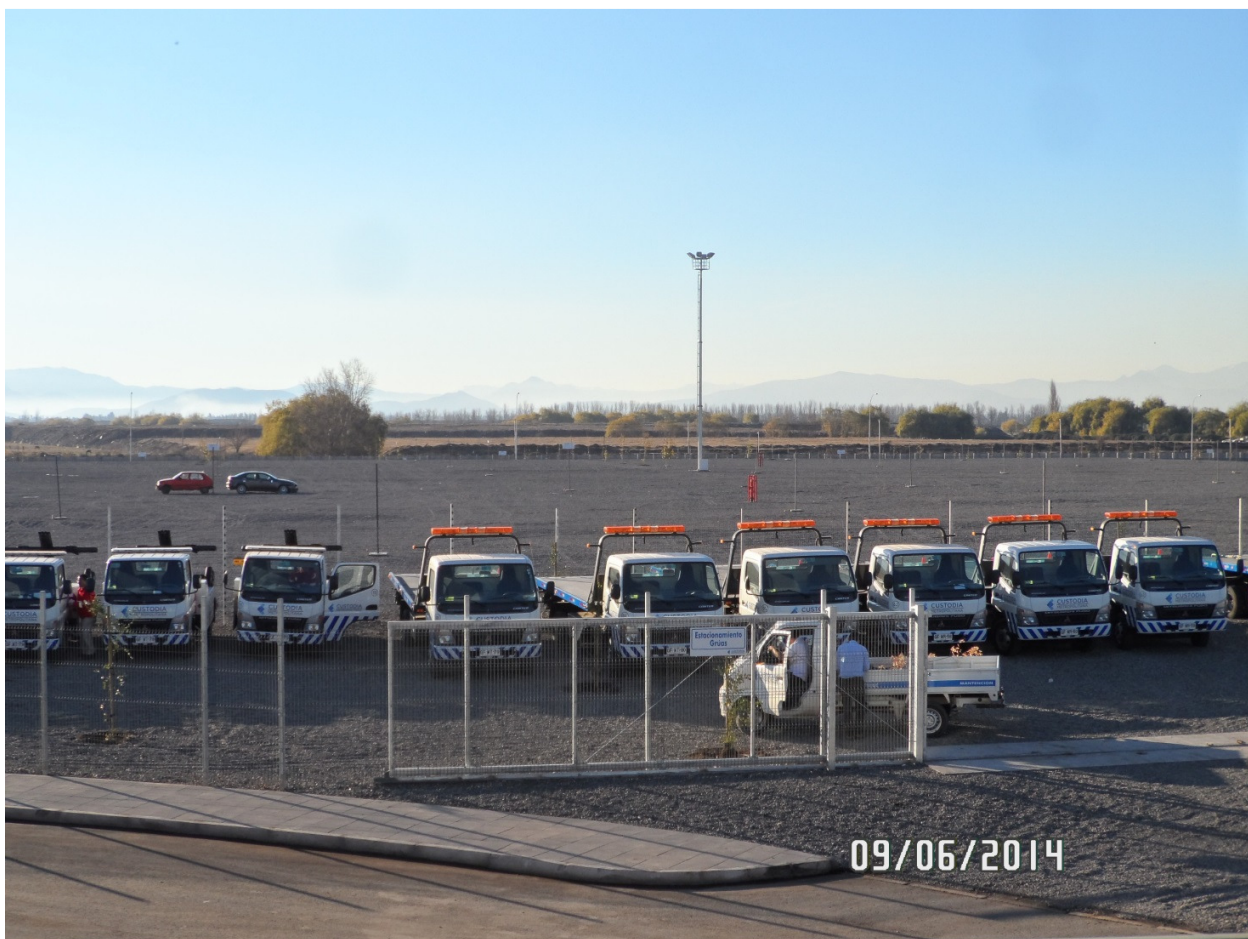
Zona de estacionamiento de grúas de la SC