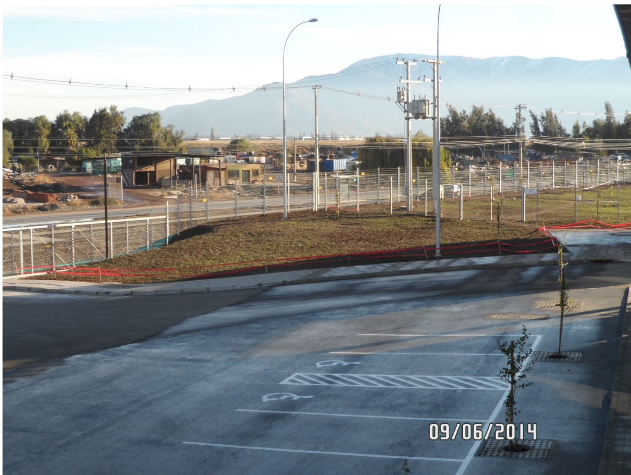
Zona de estacionamiento visitas/clientes del CMVRC, acceso Av. Lo Echevers 920