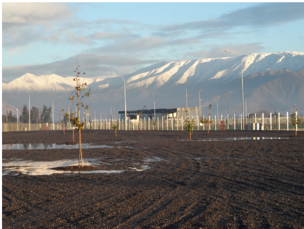
Zona de parqueadero fiscalia, vista del edificio CMVRC