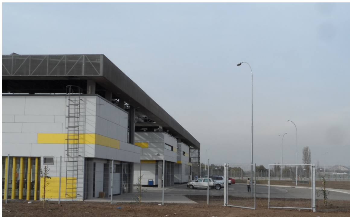
Vista lateral al edificio CMVRC