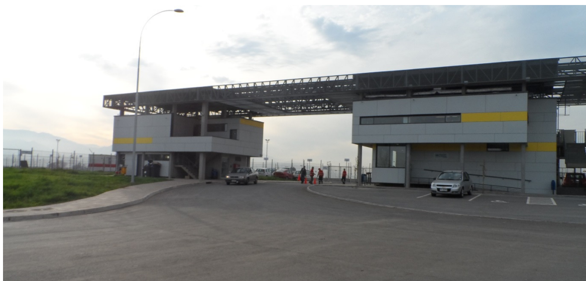
Vista Frontal del Edificio CMVRC