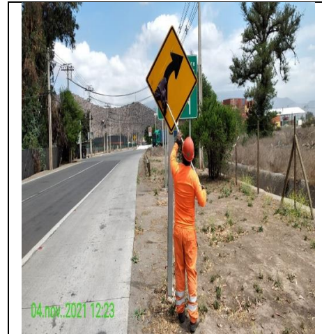
Mantenimiento y conservación de señales verticales

Mantenimiento de la infraestructura preexistente durante el periodo