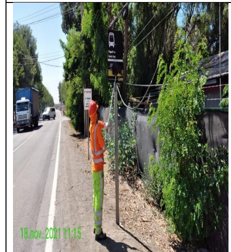
Mantenimiento y conservación de señales verticales