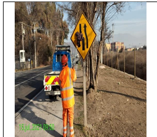
Mantenimiento y conservación de señales verticales

Mantenimiento de la infraestructura preexistente durante el periodo