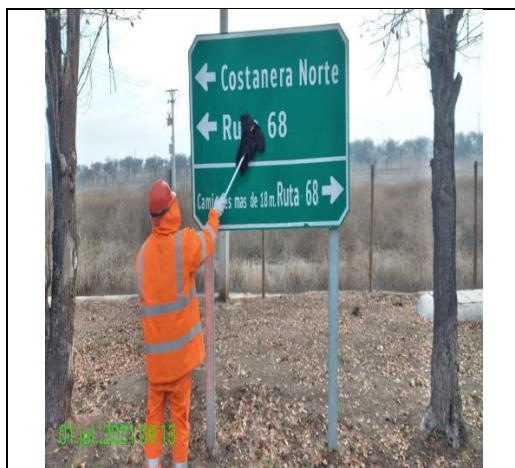
Mantenimiento y conservación de señales verticales