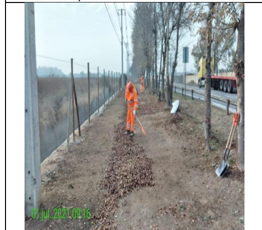
Mantenimiento y conservación de paisajismo