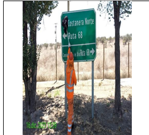
Mantenimiento y conservación de señales verticales