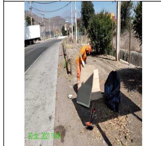
Mantenimiento y conservación de paisajismo