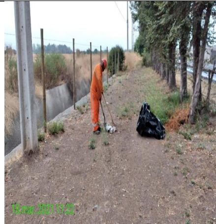
Mantenimiento y conservación de paisajismo