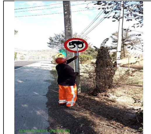
Mantenimiento y conservación de señales verticales