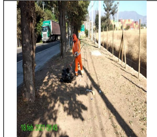
Mantenimiento y conservación de paisajismo