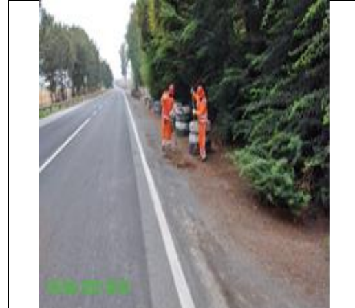
Mantenimiento y conservación de paisajismo