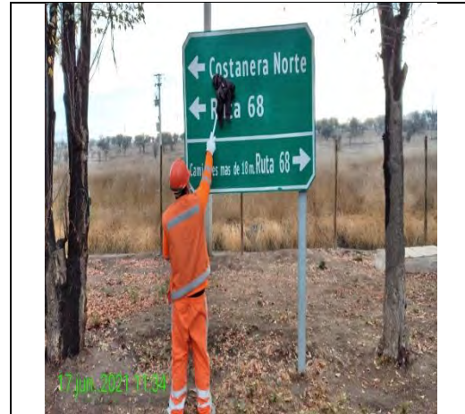
Mantenimiento y conservación de señales verticales