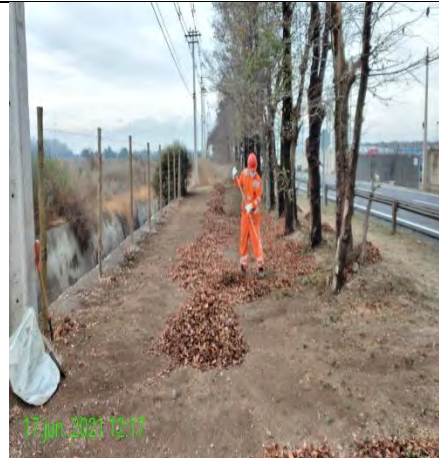
Mantenimiento y conservación de paisajismo