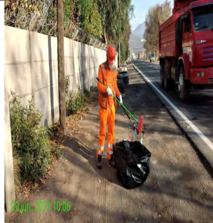
Mantenimiento y conservación de paisajismo