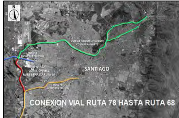
En rojo, emplazamiento en Región Metropolitana

El proyecto se encuentra emplazado en el sector Poniente de Santiago, entre las Comunas de Pudahuel y Maipú, próximo al río Mapocho, entre el Enlace del “Sistema Oriente – Poniente” con la “Interconexión Vial Santiago – Valparaíso – Viña del Mar” por el norte, y el empalme con la “Autopista Santiago – San Antonio, Ruta 78” por el sur.