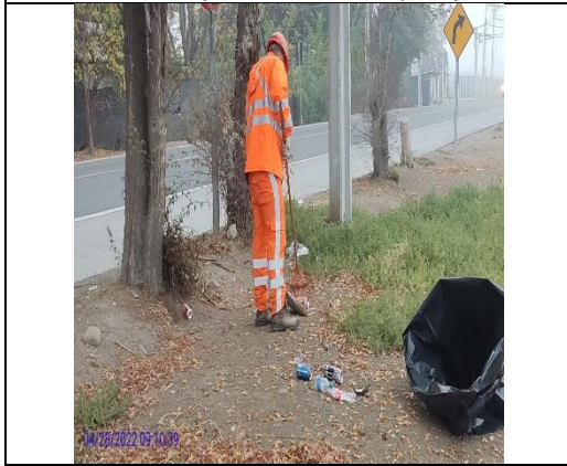
Mantenimiento y conservación de paisajismo