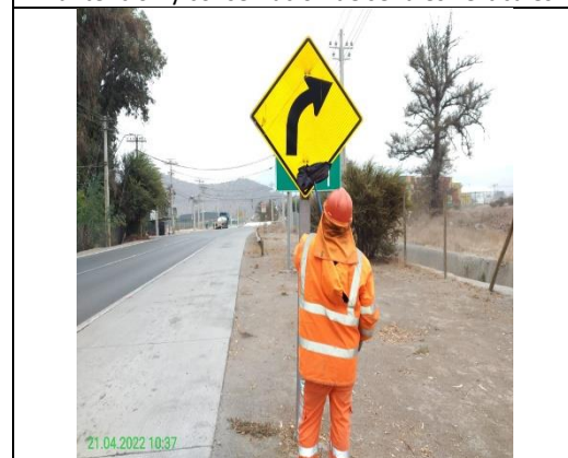
Mantenimiento y conservación de señales verticales