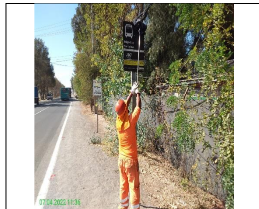
Mantenimiento y conservación de señales verticales

Mantenimiento de la infraestructura preexistente durante el periodo