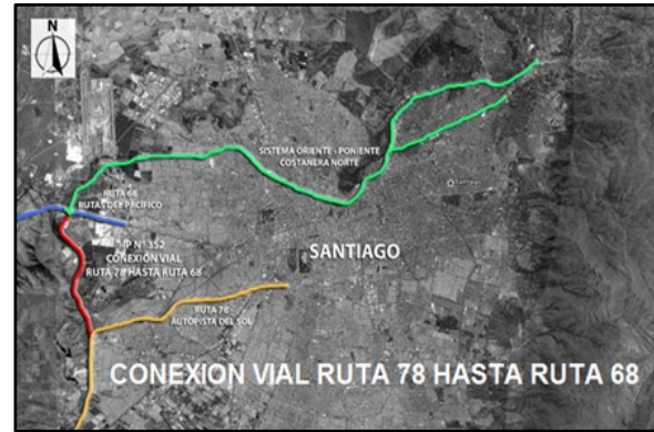
En rojo, emplazamiento en Región Metropolitana

El proyecto se encuentra emplazado en el sector Poniente de Santiago, entre las Comunas de Pudahuel y Maipú, próximo al río Mapocho, entre el Enlace del “Sistema Oriente – Poniente” con la “Interconexión Vial Santiago – Valparaíso – Viña del Mar” por el norte, y el empalme con la “Autopista Santiago – San Antonio, Ruta 78” por el sur”.