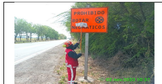
Mantenimiento y conservación de señales verticales

Mantenimiento de la infraestructura preexistente durante el periodo.