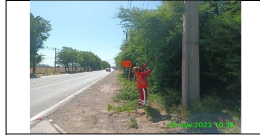
Mantenimiento y conservación de paisajismo