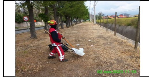
Mantenimiento y conservación de paisajismo