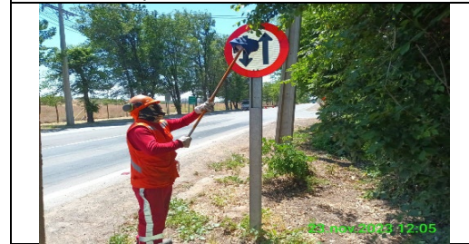
Mantenimiento y conservación de señales verticales