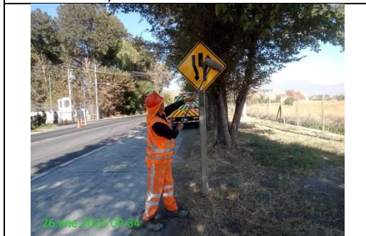
Mantenimiento y conservación de señales verticales