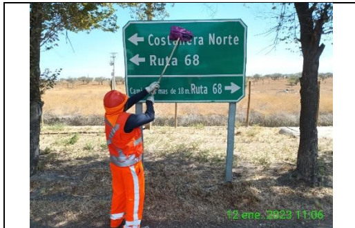
Mantenimiento y conservación de señales verticales

Mantenimiento de la infraestructura preexistente durante el periodo