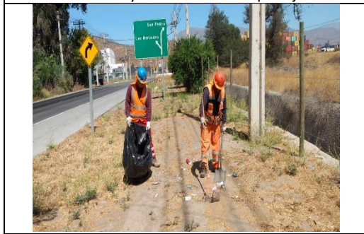
Mantenimiento y conservación de paisajismo