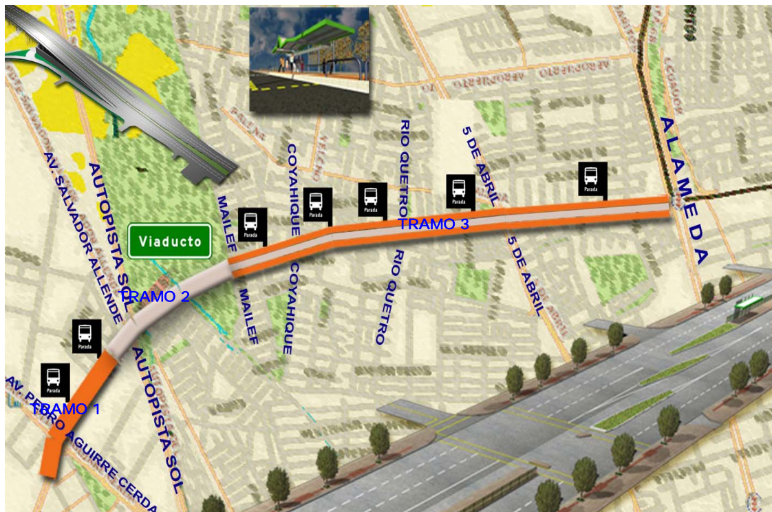
Figura 1 Plano de ubicación de la Concesión Conexión Av. Suiza – Las Rejas