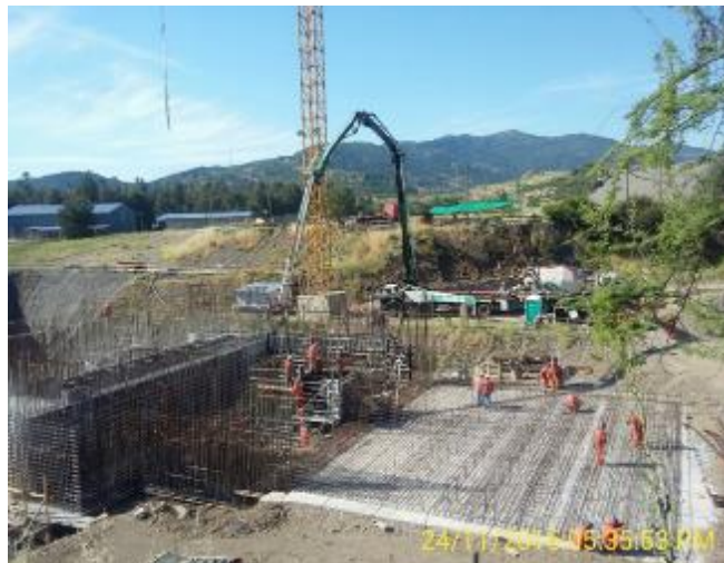
Hormigón muros 21 y 22. 1ª Elevación de la 5ª Etapa de Hormigonado. 40 m 3 H25.