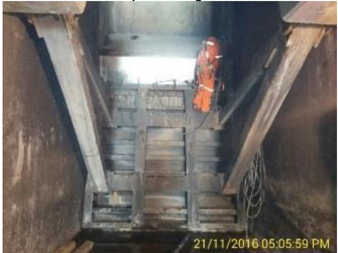
Inicio el desarme de la Compuerta Radial de la Cámara de Válvulas del Túnel Sur.