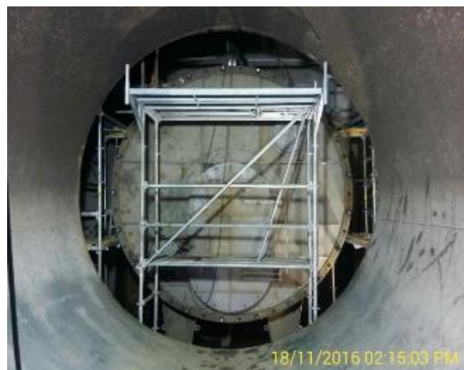
Instalación de las Patas de Soporte de la Válvula Mariposa y posteriormente, instalación de la Tapa Provisoria de la Tubería de 3800 mm.