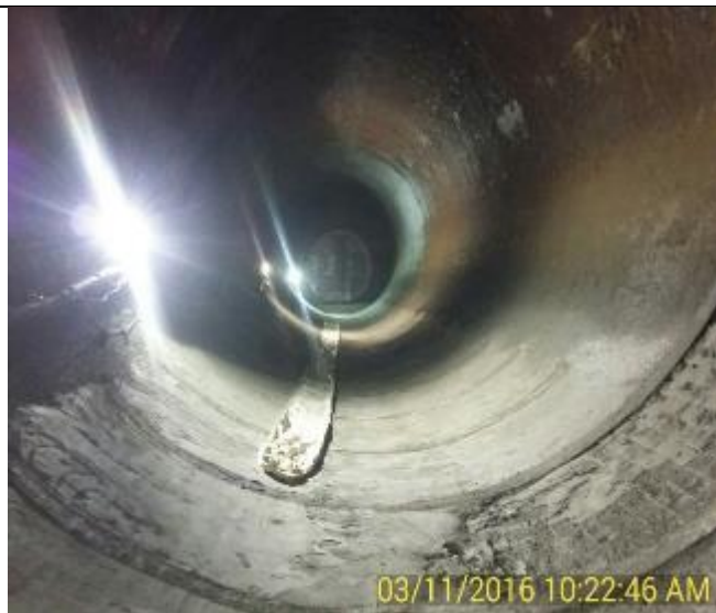
Terminación del Shotcrete entre vigas T con malla Acma. Empresa Castellum Ing. y Construcciones Spa. Al fondo se aprecia la Compuerta de Segmentos de la Aducción Horizontal, instalada por los Buzos de la Empresa Trasubmar Ltda.