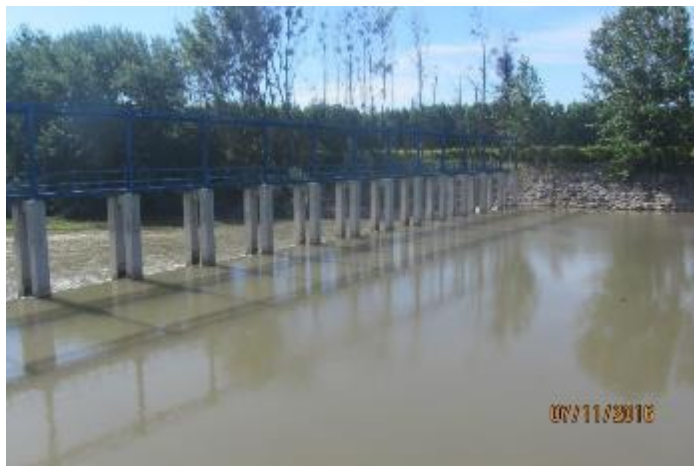
Bocatoma Uva Blanca

El embalse al 30.11.2016 quedó con una cota de nivel de agua 267,950 msnm que equivale a un volumen embalsado de 235.681.149 m 3 .