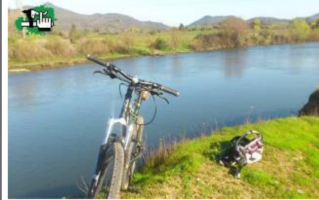
Lámina N°1: Se observa sector denominado “Canalón”

herramienta ecológica , que los profesores de los distintos escuelas no tan solo de Chimbarongo, sino también de otras comunas como Chépica, San Fernando, Teno y Santa Cruz, utilizarán para sus alumnos.