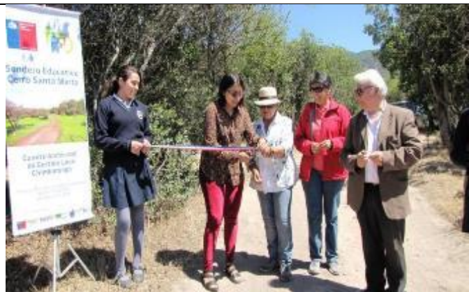
Lámina N°2: Seremi de Medio Ambiente, inaugurando el sendero Cerro Santa Marta

Una de las principales áreas que cumplen con los requisitos para desarrollar acciones recreativas y turísticas, se encuentra aguas abajo de la presa auxiliar, lugar denominado canalón, cuyos atributos ambientales son aptos, debido a que cuenta con acceso vial, una calidad visual y paisajística de gran valor y por sobre todo no se encuentra bajo jurisdicción de la Sociedad Concesionaria. Cabe destacar que en esta convocatoria realizada por la comunidad estuvo presente la Seremi de Obras Públicas, la Unidad de Medio Ambiente y territorio de CCOP y la Inspección Fiscal respectiva.