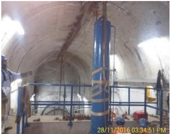
Maniobra de retiro del Cilindro de la Compuerta Bureau de la Cámara de Válvulas del Túnel Sur.