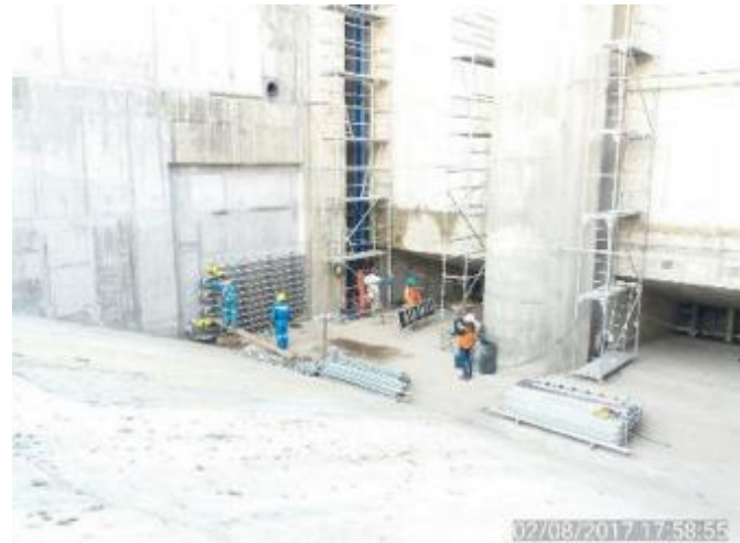
Instalación de los Intercambiadores de Calor y montaje de las Guías de las Compuertas en el Canal de Descarga.