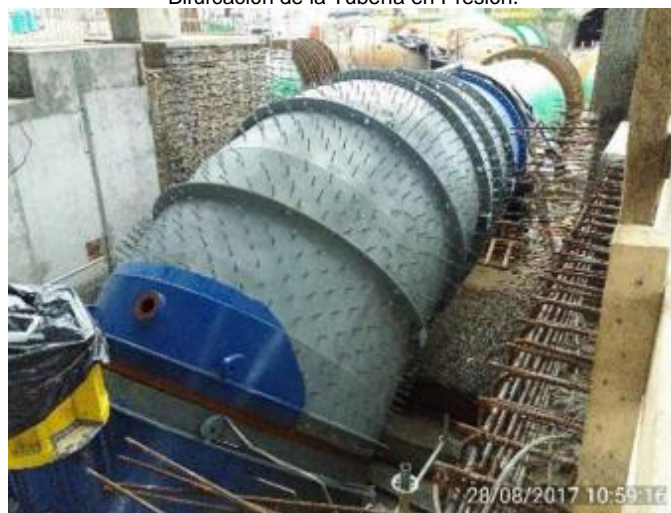
Posicionamiento y ajustes del Codo de la Aducción de la Turbina N° 2 de la Central Hidroeléctrica Convento Viejo.