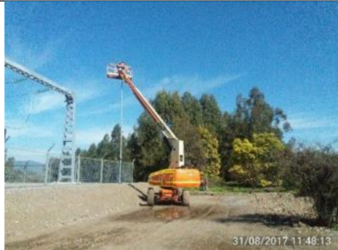
Instalación de Luminarias en Subestación Eléctrica Seccionadora de la CHCV.