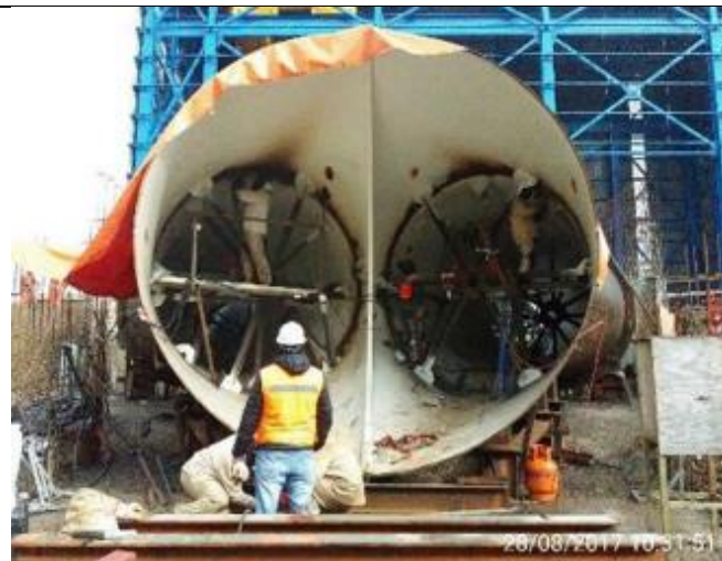
Soldaduras de remate tramos BC con C1 y BC con C2 de la Bifurcación de la Tubería en Presión.