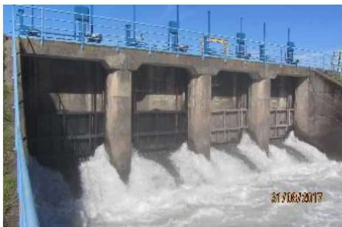
Bocatoma Canal Teno-Chimbarongo

Con fecha 27 de Agosto de 2017 la estación Estero Chimbarongo Bajo Embalse Convento Viejo (Lo Toro del embalse Convento Viejo) registró una entrega máxima de 77,462 m 3 /s con objetivos: ecológicos, regadío e hidroeléctricos de la central Rapel.