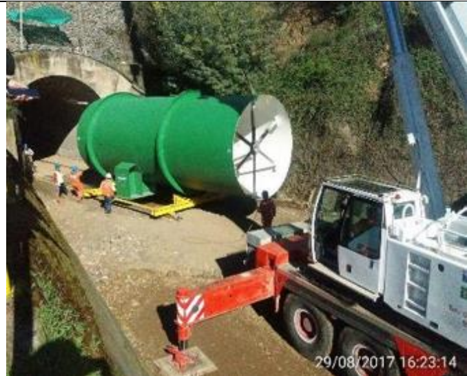
Traslado de tramo o módulo de la Tubería en Presión de 3800 mm hacia el interior del Túnel Sur.