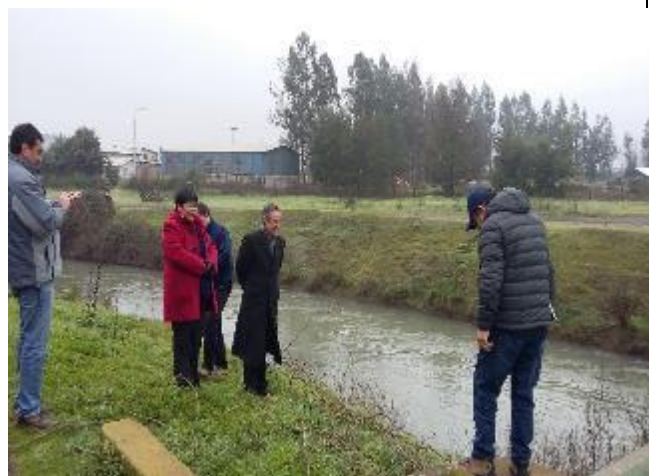
Alcaldesa de Teno recorriendo en conjunto con el Inspector Fiscal, el canal Teno-Chimbarongo.

Una vez contado con este informe, se podrán determinar lineamientos de acción, correspondiente a la regularización legal de los lotes e identificar aquellas superficies del canal, que son prescindibles para la operación, abriendo una oportunidad de entregarlos al Municipio respectivo para integrarlo a la comunidad en el plan regulador de la comuna, tal como lo pretende la Ilustre Municipalidad de Teno.