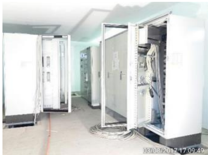
Conexión en Gabinetes de Protección y Control de la Sala Eléctrica de la Subestación Seccionadora de la Central Hidroeléctrica.