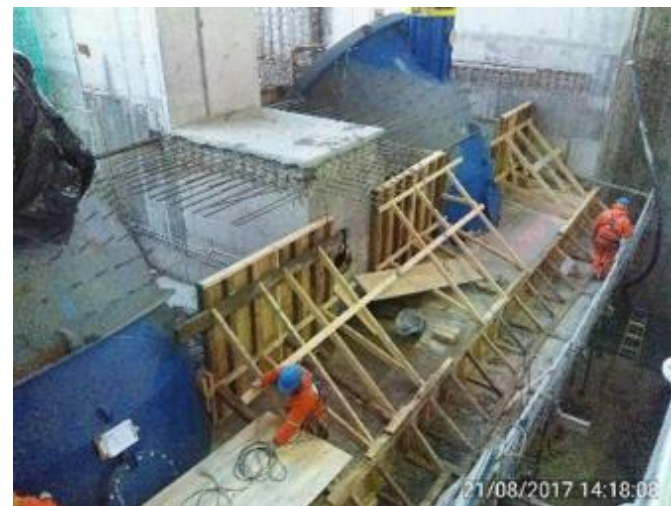
Confección del Moldajes para losa nivel 239,7 de las Turbinas de la Central.