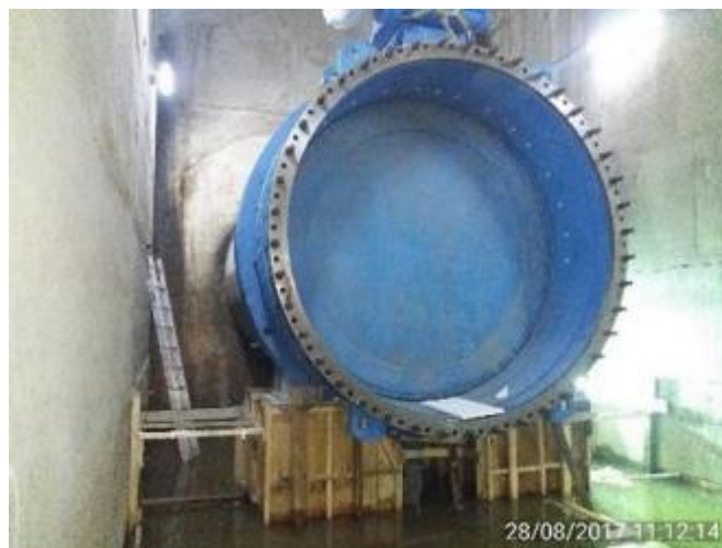
Tubería de Aducción con la Válvula Mariposa y Junta de Dilatación. Se aprecia el moldaje y hormigón de la Fundación 15, soportante de la Válvula de Seguridad Tipo Mariposa de 3800 mm.