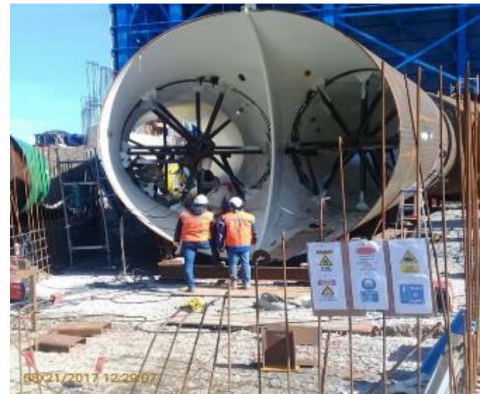
Instalación de señalética asociados a los riesgos y áreas restringidas