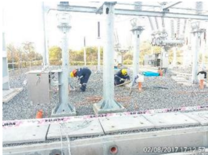
Puesta a Tierra de las Estructuras de la Subestación Eléctrica Seccionadora de la Central.