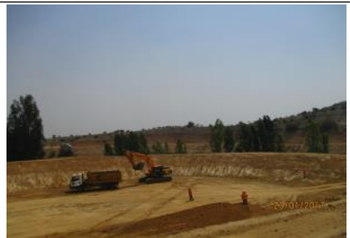
Movimientos de tierra Tranque Nicolasa Oriente Km. 33,200 del Canal Norte, Tramo 2.