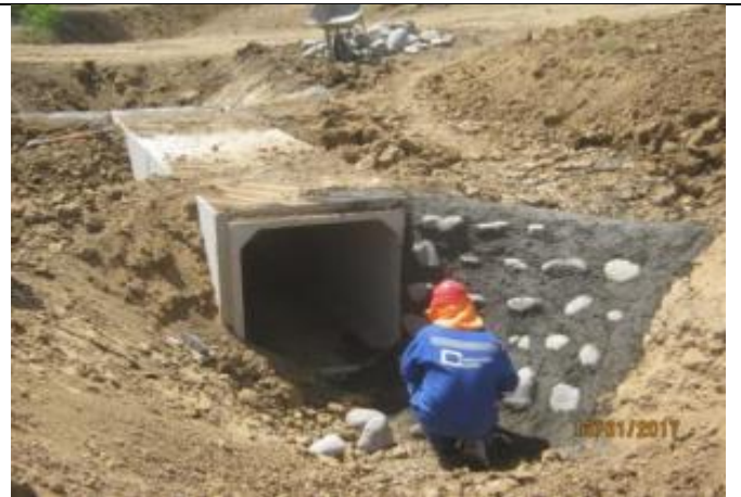
Mamposterías de entrada y salida, acceso a predio; Km 1,150.