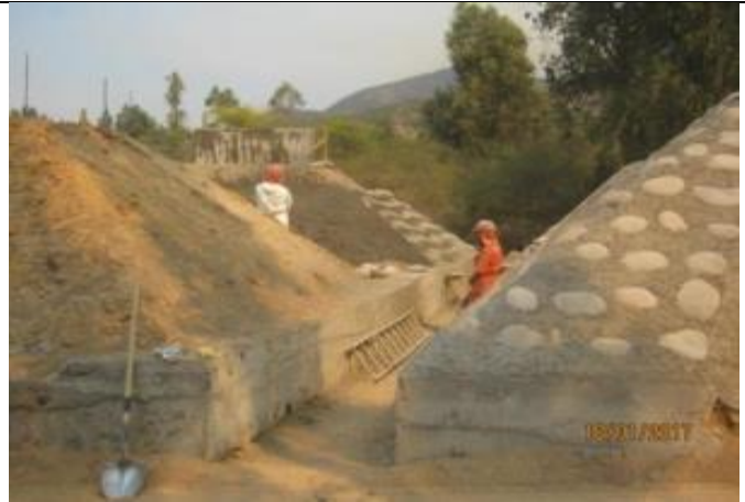
Excavación, hormigonado base y mampostería CQ7, Km 12,970.