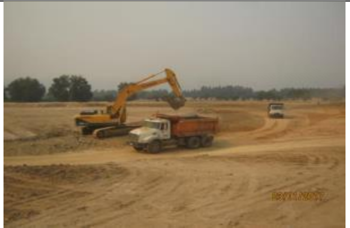
Movimientos de tierra, Tranque Las Ovejas; Km 11,200.