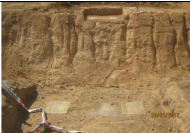
Hormigonado fundaciones e instalación placas de apoyo, pasarela ganado, Km 21,250.