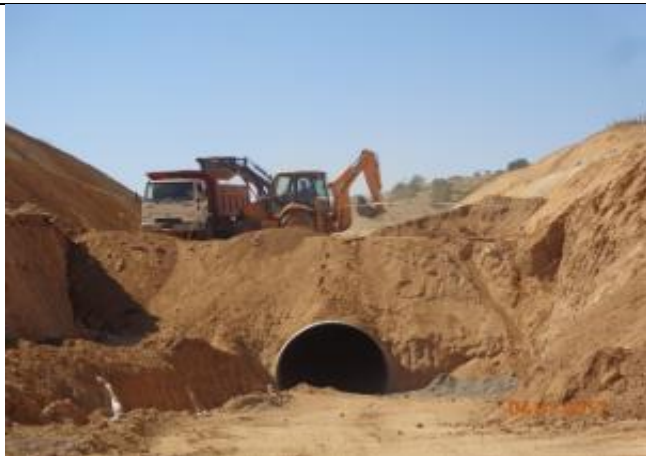
Relleno Estructural, Km 21,100.