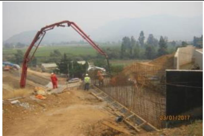
Enfierraduras y hormigonado losa, bajada rebalse CNU; Km 12.200.