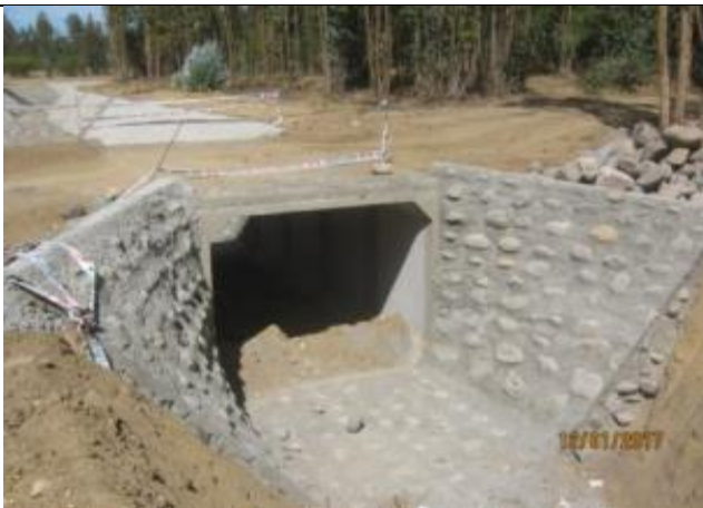
Mampostería salida, acceso a predio, Km 14,700.