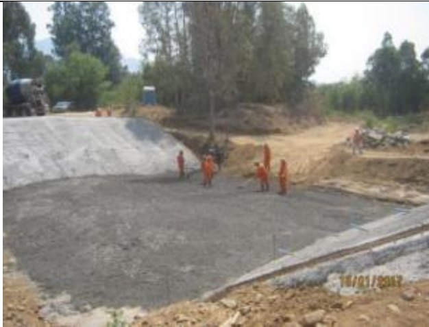
Hormigonado piso, Enrocado Badén Estero Fortaleza, Km 1,330.