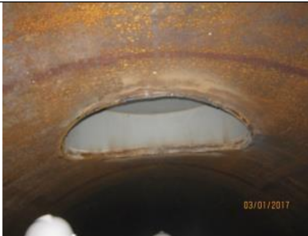
Revisión detalles constructivos (biselado venteos) y sello sikaflex, interior sifón (Km 0,040 – Km 0,800).