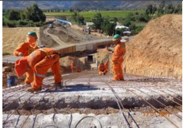
Armadura Rápido, Vertedero Sifón Nerquihue.