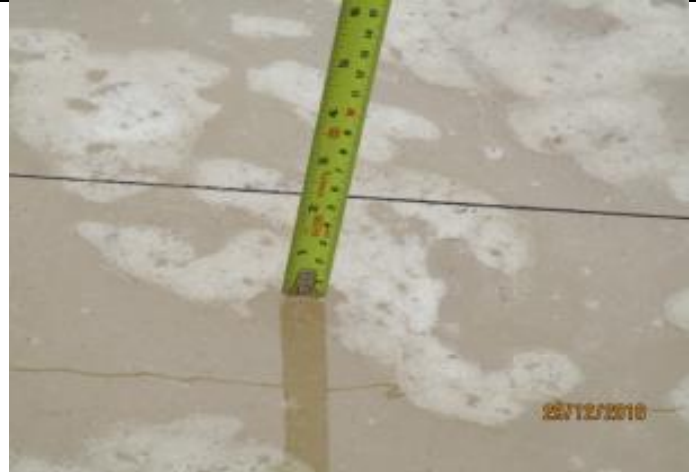
Ensaye Porchet Tranque La Palma Alta, Km 14,340.