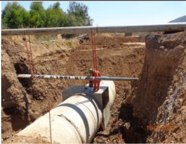
Aplicación Igol dado de unión, Km 1,250.