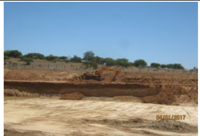
Movimientos de tierra Tranque El Membrillo, Km 38,280