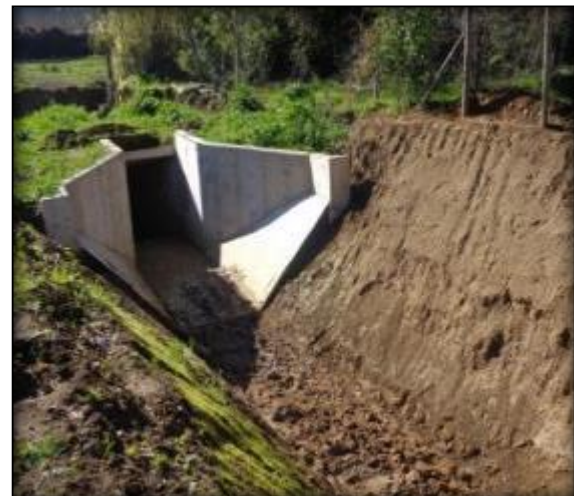
Cámara de salida de Sifón Fortaleza.

Esta obra permite dar continuidad al Canal Lolol Sur y se ubica entre el Km 0.850 y el km 0.925 de éste. Se proyecta en 75 m de largo y en un diámetro de 1,85 m en acero, para cruzar el Estero Fortaleza. (En operaciones)