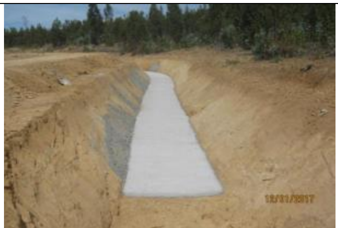
Revestimiento fondo canal (Km 15,020 – Km 15,120).