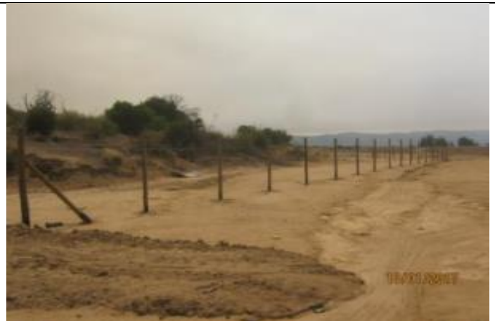
Instalación de cercos (Km 19,400 – Km 20,500).