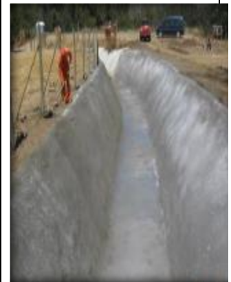
Canal revestido, (Km. 1,600- Km 1,645).