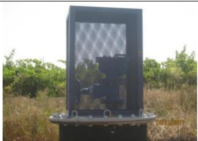
Instalación válvulas de ventosas (Km 0,145 – Km 0,795).