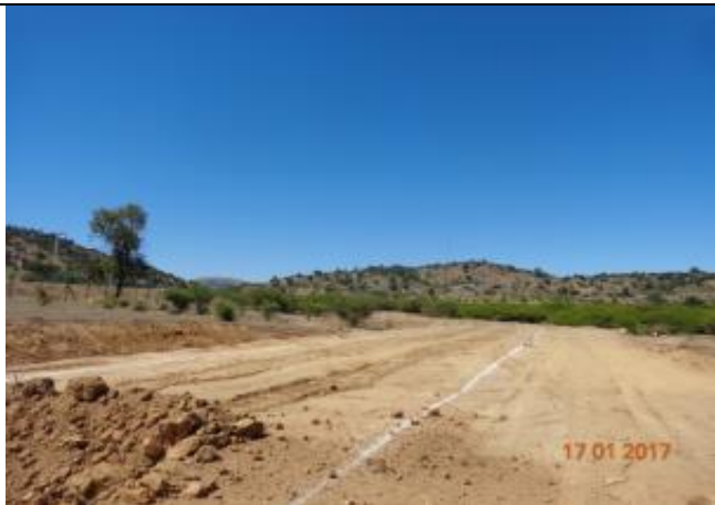
Excavación corte de Canal, Km 16,300.