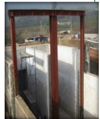
Insertos metálicos para compuertas.