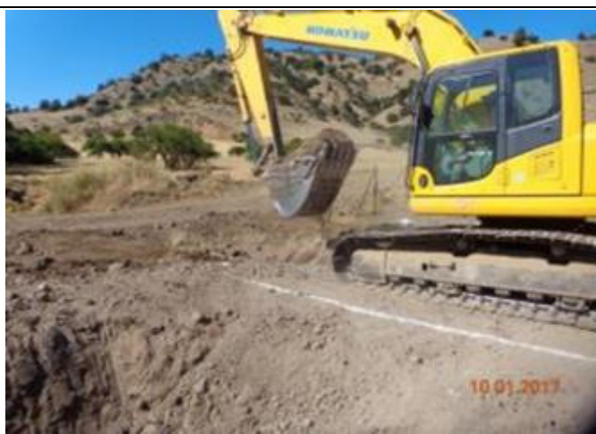
Excavación Cruce de Quebrada; Km 0,285.