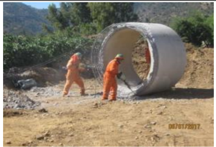
Preparación sello mejorado e instalación tubos prefabricados, cruce camino "La Cabaña" (Km 1,260 – Km 1,310).