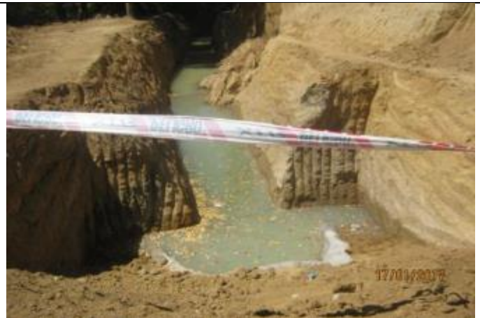
Relleno estructural y mampostería de salida, tubería HDPE quebrada; Km. 31,380.