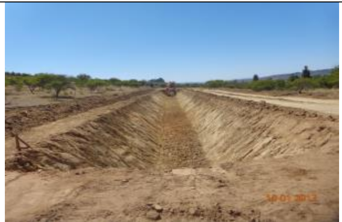
Excavación corte de Canal, Km 16,760.