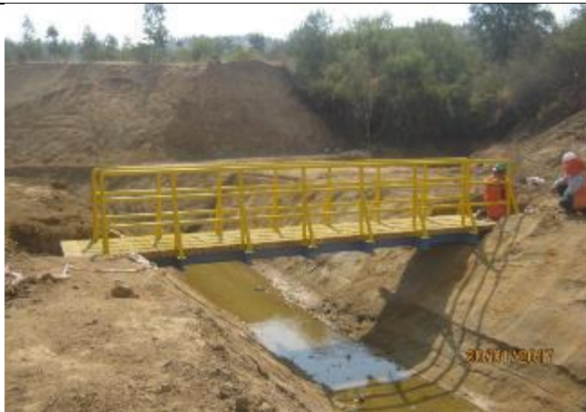
Instalación pasarela ganado; Km. 31,370.