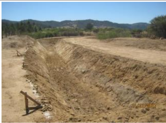
Movimientos de tierra; (Km. 46,650 – Km. 47,400).