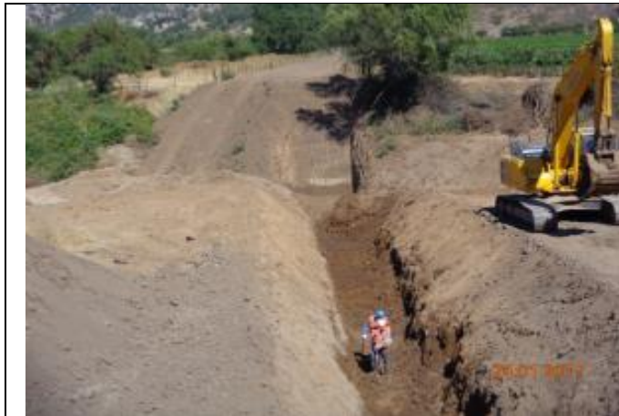
Mampostería Mini Descarga; Km 4,280.