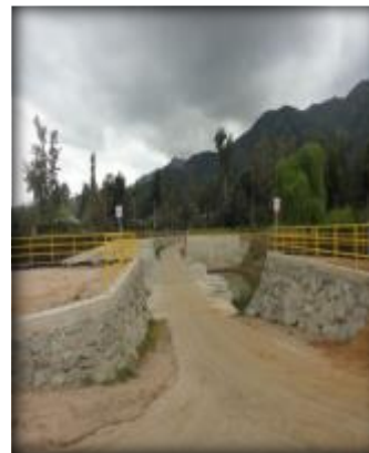
Vista panorámica Bocatoma Canal Lolol Sur.

Los recursos de este canal permitirán regar los sectores de Pastizales, Lolol Bajo, El Peumo, La Palma, Monterina Baja, Tres Esquinas, Vaticano, Portezuelo y El Guaiquillo.