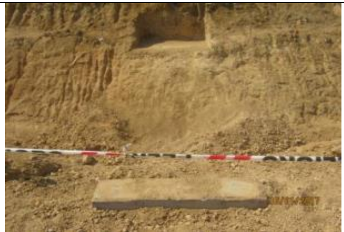
Hormigonado fundaciones e instalación placas de apoyo, pasarela ganado, Km 23,680.