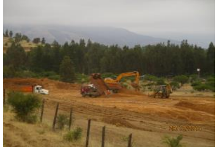
Movimiento de Tierra, Tranque La Vega Este, Km 24,820 del Canal Norte, Tramo 1B.