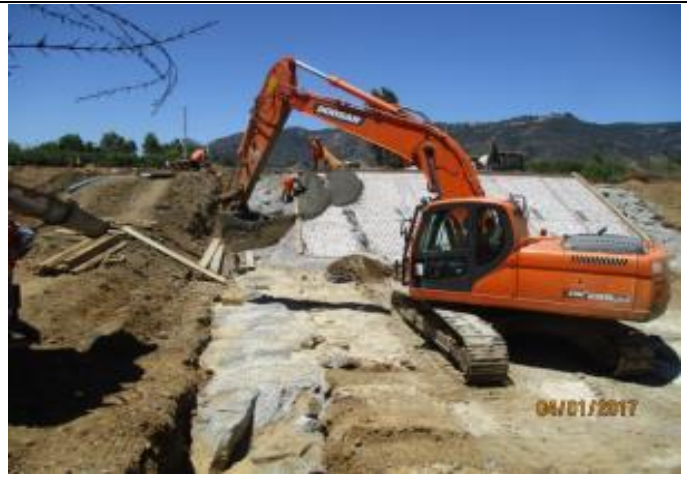
Hormigonado de talud lado derecho entre vértice 1 y 2, Estero Fortaleza