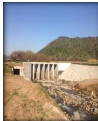
Bocatoma Canal Norte Unificado, barrera frontal.