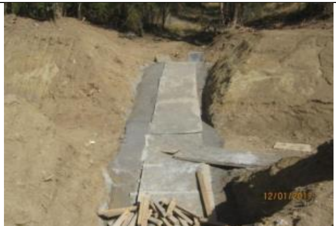
Hormigonado base CQ7, Km 14,705.