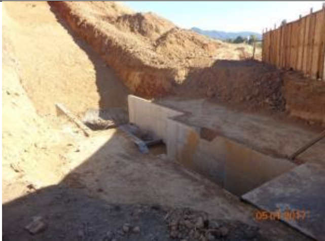
Relleno Estructural Vertedero Sifón Nerquihue