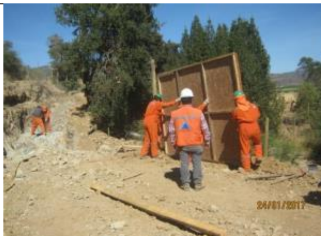
Instalación de pantallas acústicas; (Km 0,780 – Km 0,820).