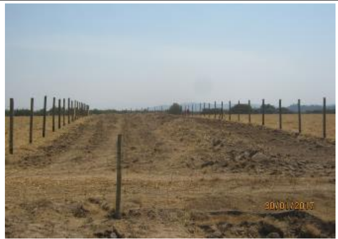
Instalación de cercos; (Km. 55,600 – Km. 56,900).