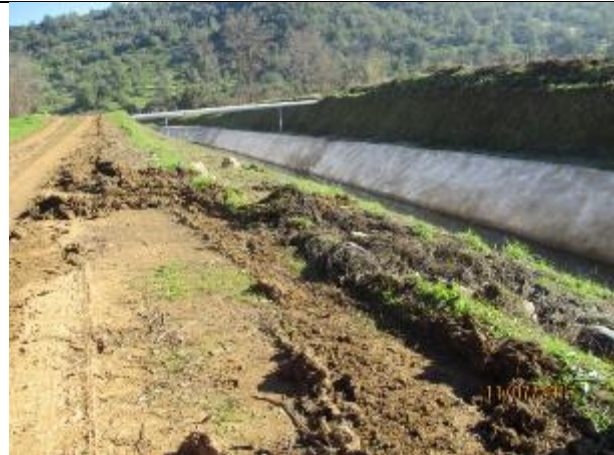
Limpieza general del Canal Norte Unificado Km 0,460