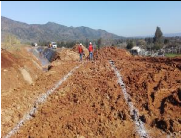
Trazado y excavación Obra de Arte, Km 8,815.