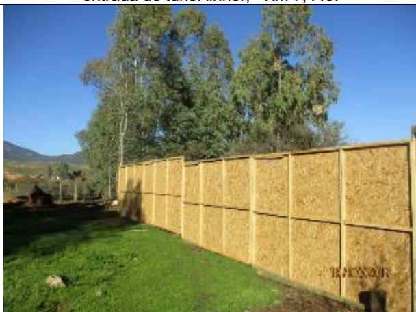
Pantallas Acústicas, Km 8,000.