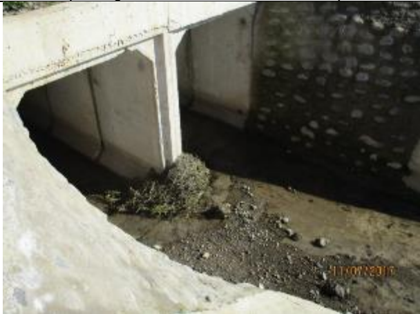
Limpieza general del Canal Norte Unificado, Paso Predial Km 0,600