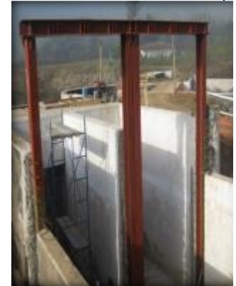
Insertos metálicos para compuertas.