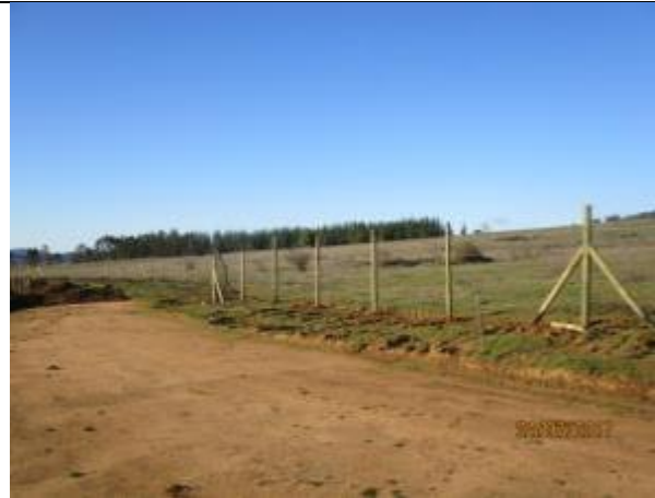
Instalación cercos (Km 49,060 - Km 49,300).