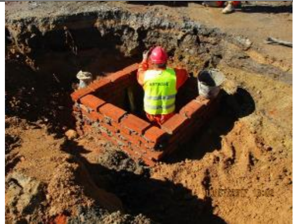
Cambios de servicios en sector urbano, (calle El Arrayán).