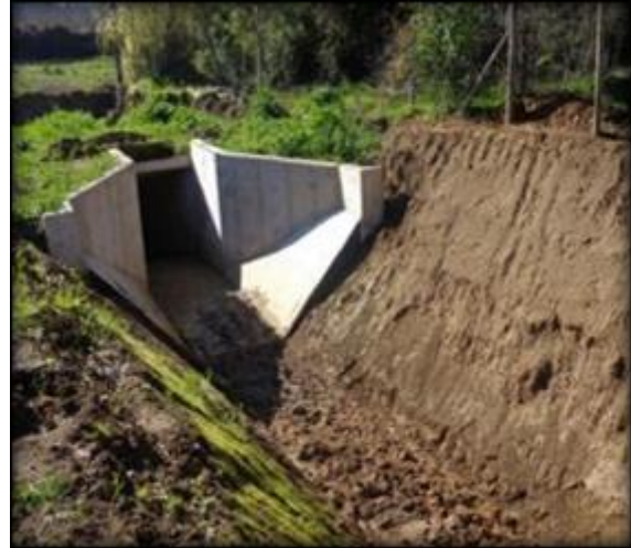
Cámara de salida de Sifón Fortaleza.

El sifón se ubica aproximadamente entre el km 0,850 y km 0,925 del Canal Lolol Sur. Su función consiste en permitir el cruce del canal bajo el camino y el Estero Fortaleza. La longitud total de la obra del sifón es de 75 m aproximadamente, incluidas las transiciones de entrada, el canal rectangular, las cámaras y las transiciones de salida. El caudal de diseño es de 3,67 m 3 /s.