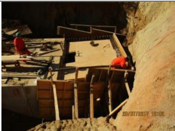
Armadura, moldaje, y hormigón de transición salida y entrada de túnel liner, Km 7,440.