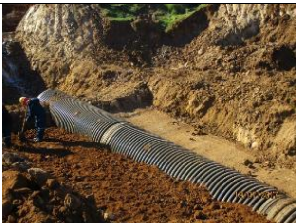
Tubo HDPE. Cruce de Quebrada, Km 8,514.