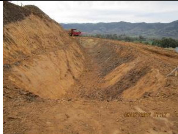
Excavación corte de canal (Km 4,700 - Km 4,900).