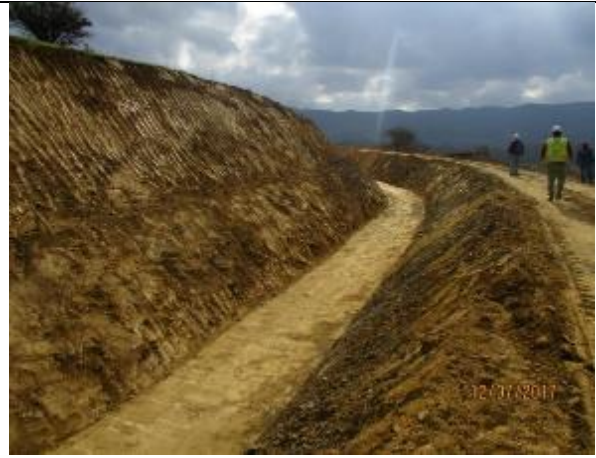
Sello fondo canal (Km 8,830 – Km 8,900).