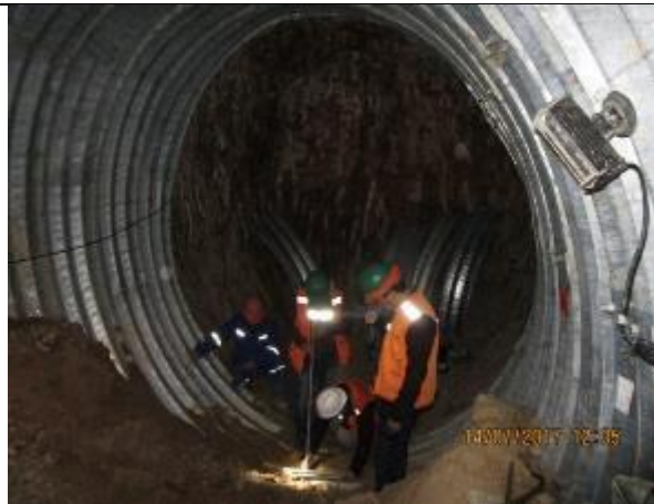
Trabajos de topografía y armado de túnel Linner, Km 7,770.