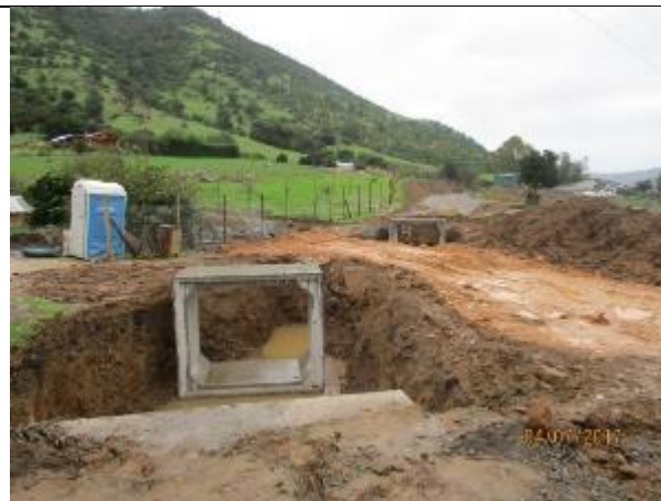
Enfierradura Muros Guarda Ruedas, Km 3,170.