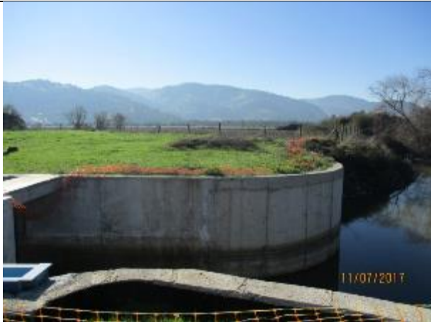
Limpieza general Sector Bocatoma Nerquihue