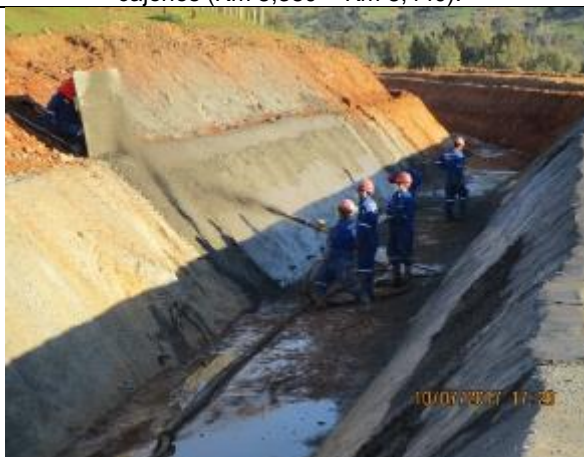
Revestimiento taludes de canal (Km 8,660- Km 8,700).