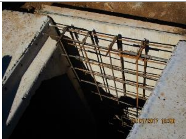
Instalación de armaduras en transición de canal, Km 3,140.