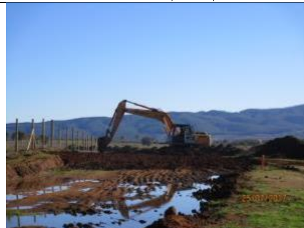
Escarpe plataforma (Km 49,400 - Km 49,460).