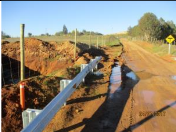
Defensa Caminera, Km 48,960.