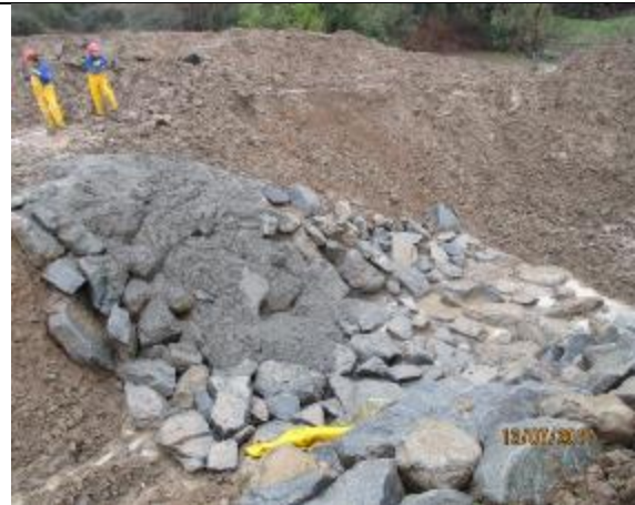
Hormigonado de enrocado consolidado