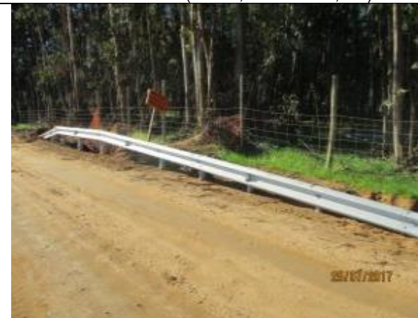
Defensa Caminera, Km 49,520.