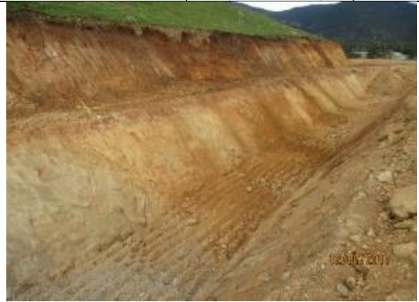
Excavación corte de canal (Km 8,920-Km 8,960)