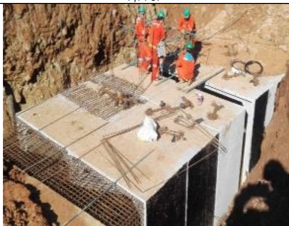
Instalación armadura y hormigonado transición de cajones (Km 8,380 - Km 8,440).