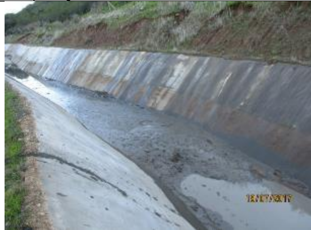
Limpieza general del Canal Km 11,860