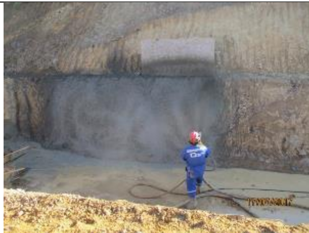
Revestimiento de talud lado izquierdo, Km 4,830.