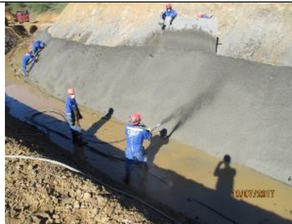
Revestimiento de talud izquierdo, Km 4,880.