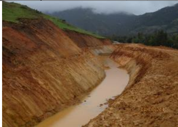
Excavación corte de Canal (Km 8,740 – Km 8,940).