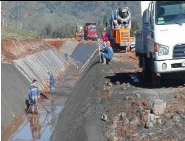
Preparación plataforma de canal (Km 4,700 - Km 5,000)