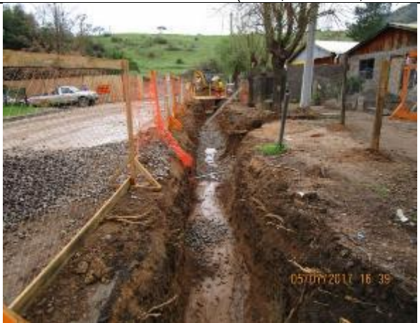
Cambio de servicio de alcantarillado en sector urbano, calle Las Pataguas.