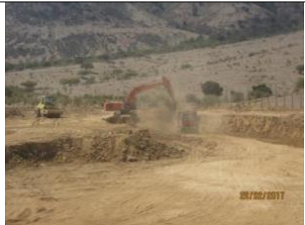
Movimiento de tierra, Tranque Almazara, Km 6,650.