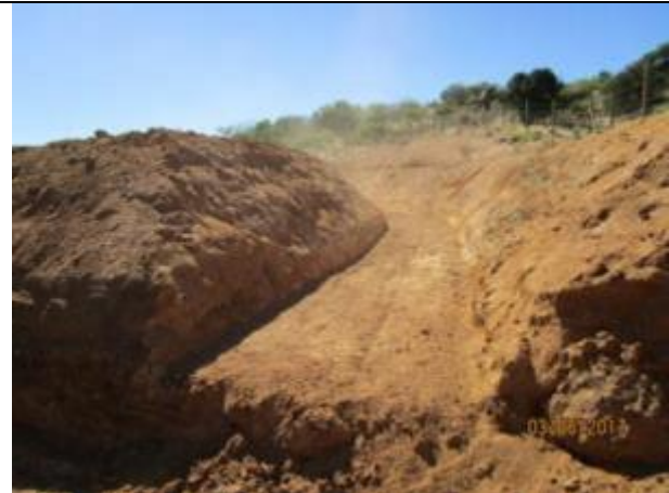
Preparación sello fondo canal (Km 19,420 – Km 20,020)