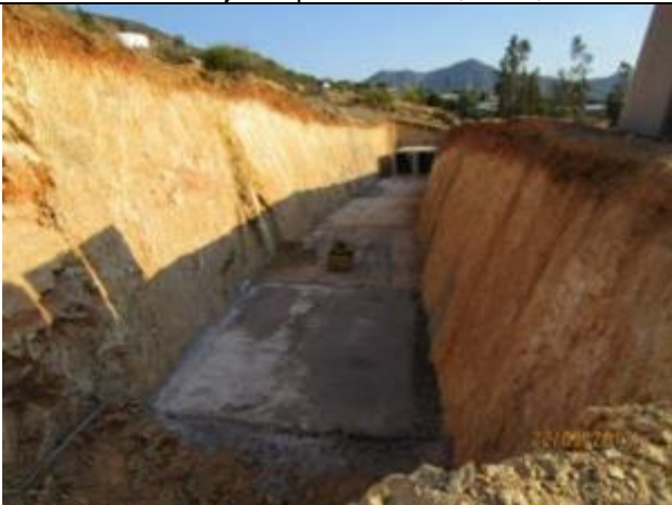
Excavación, instalación de cajones prefabricados y relleno estructural, acceso a predio, sector ferretería (Km 6,180 – Km 6,280).