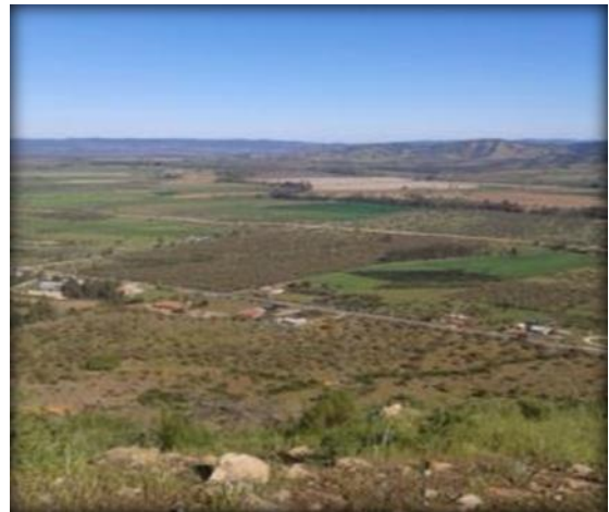
Vista panorámica del valle en Lolol, que será regado por los canales del proyecto.