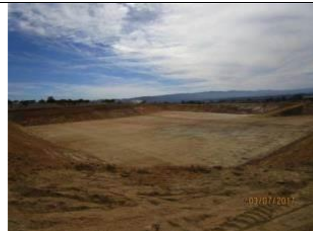
Sello fondo, Tranque El Membrillo, Km 38,360.