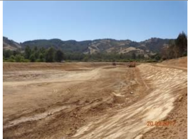
Movimiento de tierra, Tranque La Vega Alta, Km 27,500