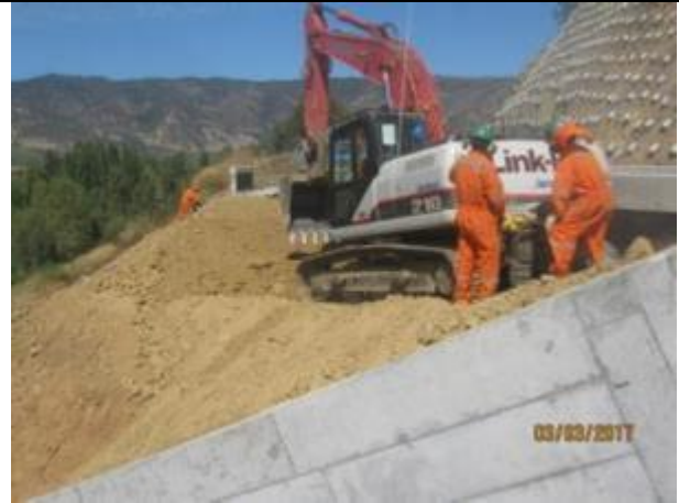
Relleno estructural costado muros, canal de descarga aliviadero.