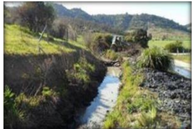
Sector de Canal Panamá Primario.

A partir del Canal Primario, se deriva el Canal Panamá Secundario, que se construirá en esta etapa, con un caudal de diseño establecido en el proyecto de la red primaria de 998 l/s, previsto para regar una superficie de 998 ha, con una longitud de 5.982 m. Será excavado en tierra sin revestimiento.