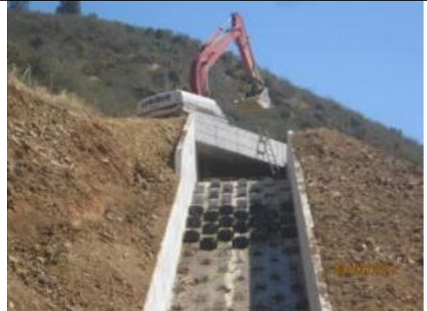
Descimbre moldaje losa superior y preparación moldaje disipadores, Canal de descarga aliviadero.