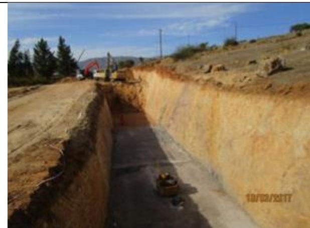
Excavación, preparación sello fundación y emplentillado (Km 7,460 – Km 7,560).