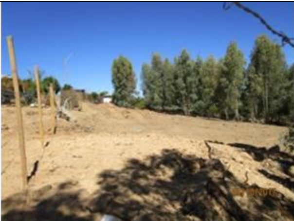
Restitución cerco perimetral (Km 7,760 – Km 7,820).