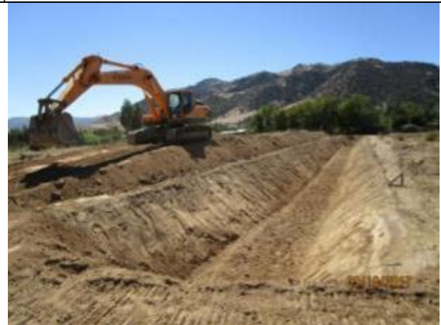
Excavación corte de canal (Km 10,480 – Km 10,560).