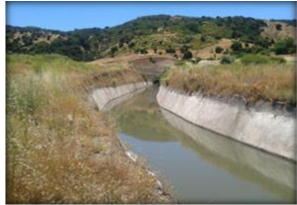
Sector de salida poniente Túnel La Lajuela.