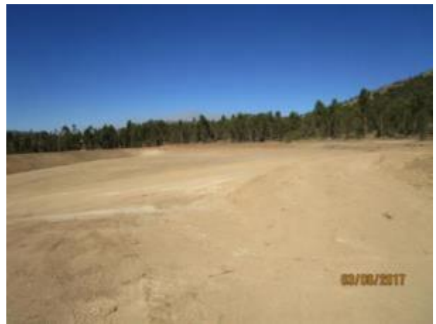
Sello fondo, Tranque La Palma Alta, Km 14,400.