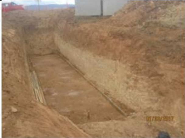
Desvío y excavación de corte en terreno natural T.C.N., cruce camino público, Km 48,940.