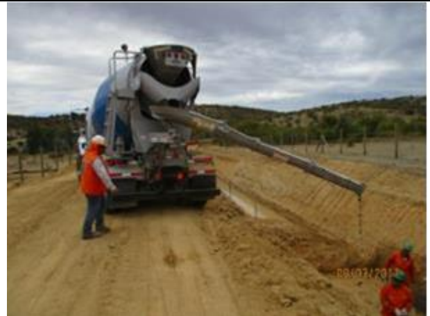
Emplantillado sello paso predial, Km 38,700.