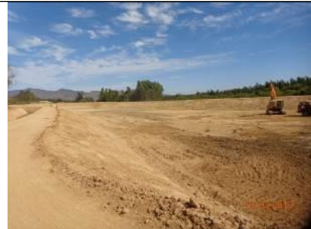
Movimiento de tierra, Tranque La Vega Alta, Km 27,180.