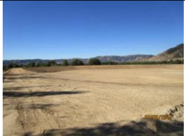
Sello fondo, Tranque Las Ovejas, Km 11,200.