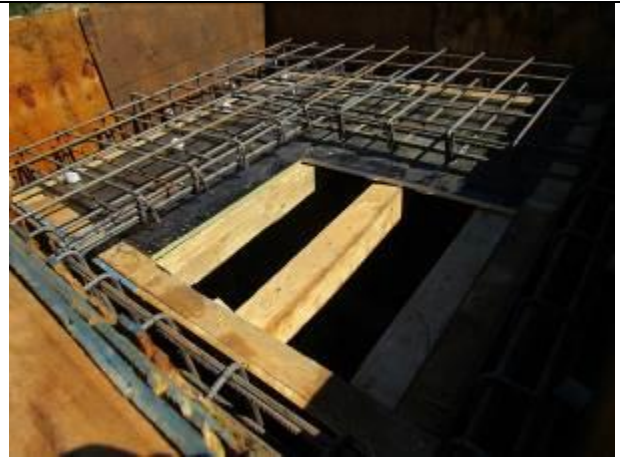
Preparación enfierradura y moldajes cámara desagüe sifón N°2, Km 0,300