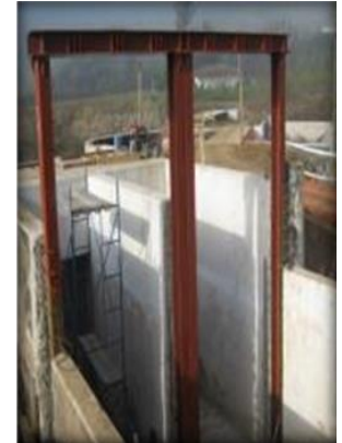
Insertos metálicos para compuertas.