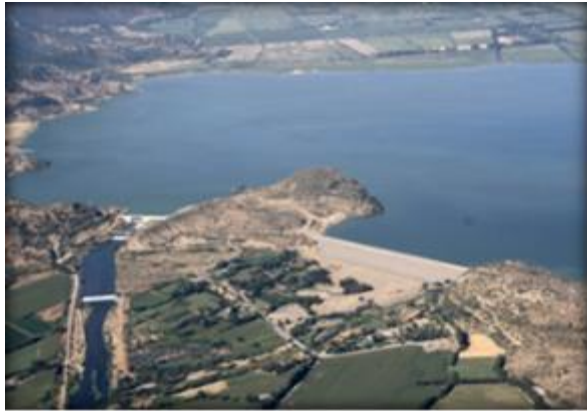
Zona de Presa y Embalse Convento Viejo.