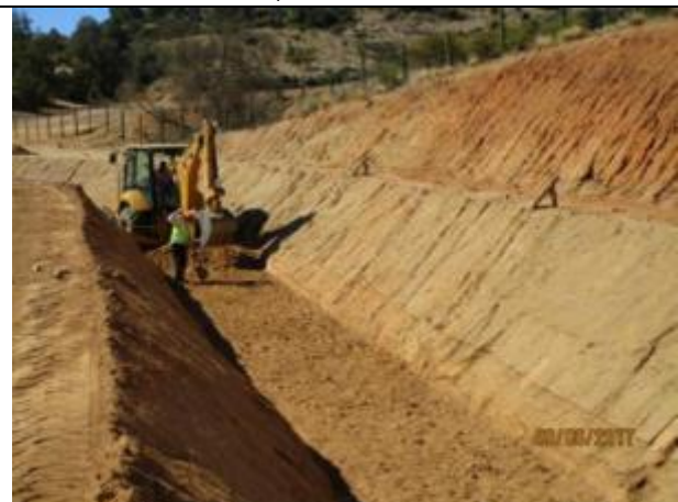
Preparación sello fondo canal (Km 21,200 – Km 21,500).