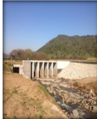
Bocatoma Canal Norte Unificado, barrera frontal.