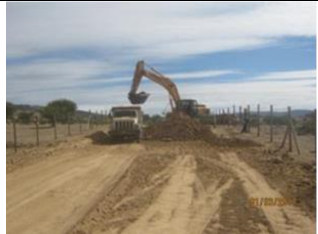
Movimiento de tierra e instalación de cercos (Km 54,500 – Km 57,100).