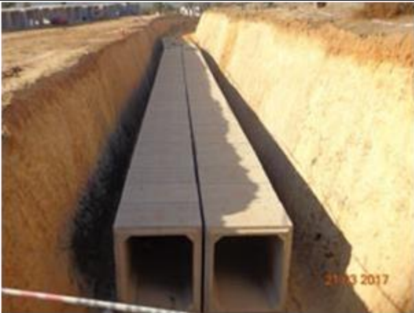
Instalación cajones prefabricados, Km 7,460.