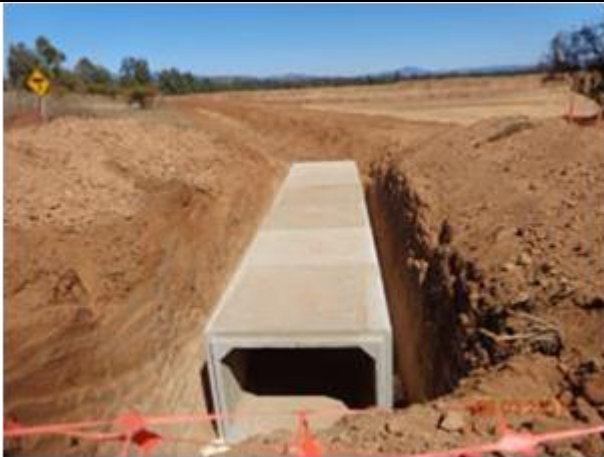
Cruce camino público, Km 48,940.