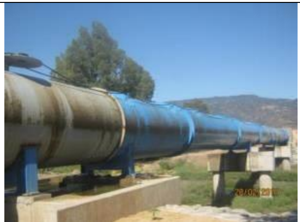
Instalación riego automático por reparación sellos en extremos paso aéreo sifón (Km 0,150 – Km 0,210).