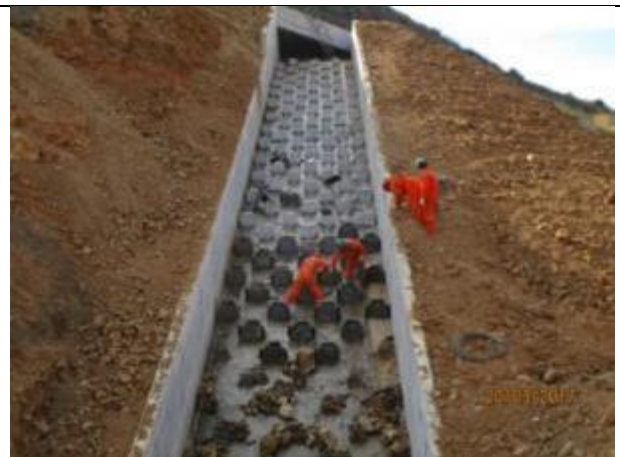
Hormigonado disipadores, canal descarga aliviadero