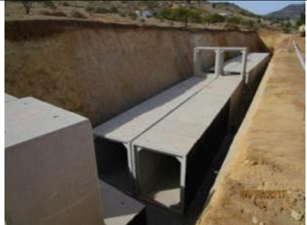
Sello fondo, emplentillado, instalación cajones y rellenos estructurales (Km 7,340 – Km 7,400).