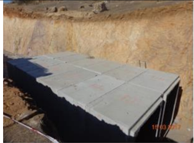
Instalación cajones prefabricados, Km 7,540