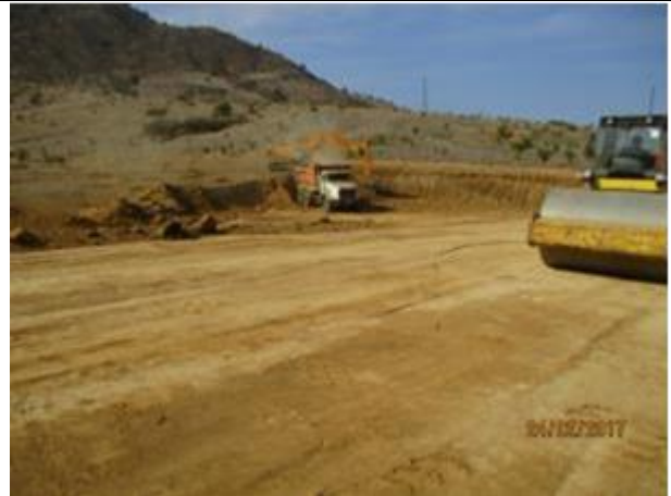
Conformación de pretilos Tranque Almazara, Km 6,650.