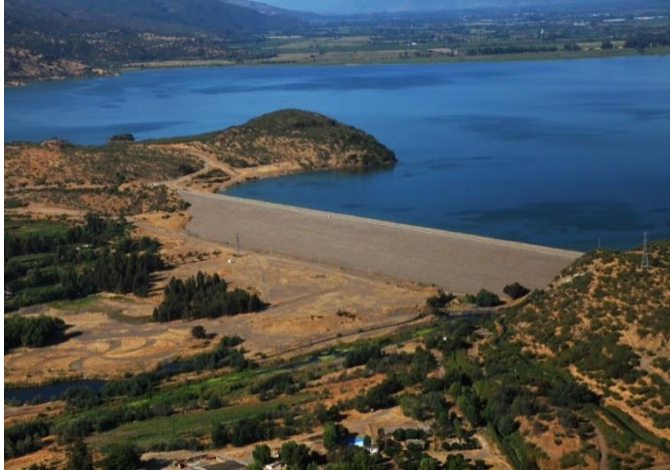
Embalse Convento Viejo, presa principal.