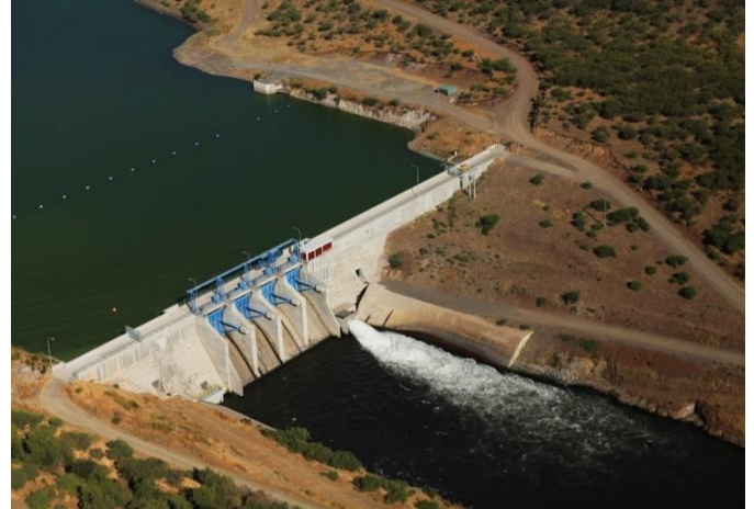
Presa auxiliar del embalse, descarga al canal