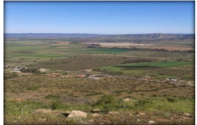
Vista panorámica, Valle de Lolol