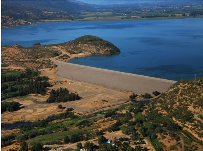
Embalse Convento Viejo, presa principal.