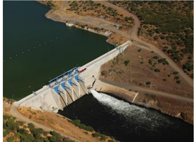
Presa auxiliar del embalse, descarga al canal