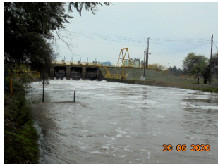
Bocatoma Canal Tenó-Chimbarongo, inició de ingreso con fecha 29/05/2020.

Permite aumentar la seguridad de riego de 38.000 há de los Valles de Chimbarongo, Las Toscas y Guirivilo. Posibilita incorporar a riego 26.000 há de secano del Valle de Nilahue. Permite la generación de energía eléctrica con la instalación de una central hidroeléctrica de 16,4 MW conectada al Sistema Interconectado Central (SIC). Permite evitar emergencias agrícolas en años secos o extremadamente lluviosos controlando crecidas. Posibilita inversiones de proyectos turísticos.