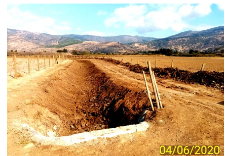
Canal Panamá, limpieza de vegetación y embanque realizada hasta el Km 4,4.

Por Resolución DGOP (exenta) N° 310 del 22-01-2018, se aprobó la Puesta en Servicio Provisoria Parcial del Canal Norte, tramos del Canal Norte Unificado que incluye su Bocatoma, Canal Norte tramo 1A, tramo 1B y tramo 2 hasta el Km 48 y Obra Canal Panamá primario y secundario.