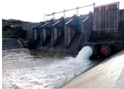
Presa Auxiliar, en operación.

Para la construcción del Embalse Convento Viejo el proyecto se desarrolló en tres fases, siendo éstas: Fase 1: Obras del Embalse: Corresponde a las obras de los Muros Principal y Auxiliar, obras de evacuación de crecidas, obras de entrega, obras de modificación de infraestructura entre las que se contaba una Variante Ferroviaria, Línea de Alta Tensión y Oleoducto.