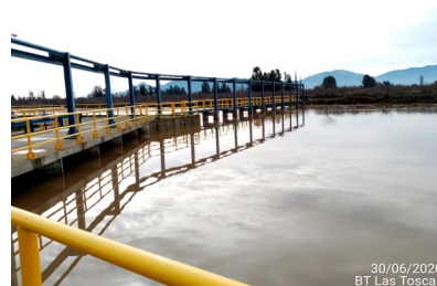
Bocatoma Las Tocas, captación y barrera durante crecida del Estero Las Toscas, 30/06/2020.

Bocatoma Uva Blanca, mejoramiento de compuertas desripadoras. A la fecha, tanto las obras de las Fases 1 y 2 y la parte señalada de la Fase 3, se encuentran con sus Puestas de Servicio Provisorias aprobadas y en operación.