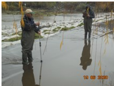
Inspección de aforos en Estero Chimbarongo bajo ECV

En el mes de junio hubo una precipitación mensual de 312,6 mm, con un acumulado anual de 339,7 mm y déficit de 0,8% a la fecha del 30 de junio de 2020. El sismo regional más intenso del periodo se dio el 19 de junio con magnitud de 4,0 MI GUC a 24 Km al E de Navidad.