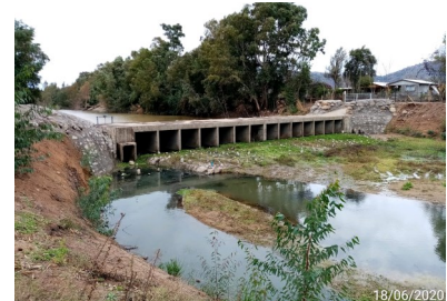
Red de canales Fase III, Poza N°1 en Estero Quiahue, Lolol.

Las obras correspondientes a la Fase 3, con la finalidad de estudiar un nuevo trazado, fueron suspendida por Resolución DGOP N° 4607, de fecha 01 de octubre de 2009, y reiniciadas por instrucción contenida en la Resolución DGOP N°262, del 25 de enero de 2013, tramitada el 30 de enero de 2013 y ratificada por Decreto Supremo N°244 del 07 de agosto de 2013 publicado el día 26 de abril de 2014. Por Resolución DGOP (exenta) N° 4875 del 18-11-2017, se encuentran con Puesta en Servicio Provisoria Parcial: que incluye el canal Lolol Sur con su Bocatoma, la Quebrada Los Cardos y el Estero Nerquihue.