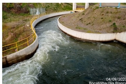
Bocatoma Uva Blanca (Canal Matriz Nilahue Tramo 1).

Fase 2: Obras Complementarias: Corresponde a la modificación y extensión de las redes existentes de conducción de agua, además del Canal Matriz Nilahue que incluye el Túnel La Lajuela.