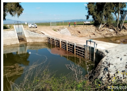
Red de canales Fase III, Poza N°2 en Estero Quiahue

Mediante la Resolución (E) N° 1722, de fecha 07 de septiembre de 2020, se materializa la Puesta en Servicio Definitiva de las Fases I, II y III, en virtud de los plazos establecidos mediante Resolución (E) DGC N° 1109, de 23 de noviembre de 2018, y a lo dispuesto en el artículo 1.10.6, de las Bases de Licitación, en concordancia con el artículo 56 del Reglamento de la Ley de Concesiones de Obras Públicas.