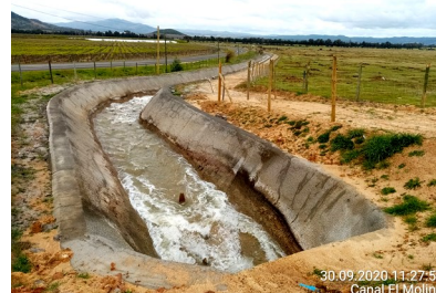
Red de canales Fase III, Canal El Molino.

Las obras correspondientes a la Fase 3, con la finalidad de estudiar un nuevo trazado, fueron suspendida por Resolución DGOP N° 4607, de fecha 01 de octubre de 2009, y reiniciadas por instrucción contenida en la Resolución DGOP N°262, del 25 de enero de 2013, tramitada el 30 de enero de 2013 y ratificada por Decreto Supremo N°244 del 07 de agosto de 2013 publicado el día 26 de abril de 2014.