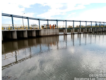
Bocatoma Las Toscas, vista desde arriba.

A la fecha, tanto las obras de las Fases 1, 2 y 3, se encuentran con sus Puestas de Servicio Provisionarias aprobadas y en operación.