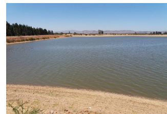
Tranque Santa Julia de 1.000.000 m3