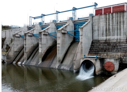
Presa Auxiliar en operación.

Para la construcción del Embalse Convento Viejo el proyecto se desarrolló en tres fases, siendo éstas: Fase 1: Obras del Embalse: Corresponde a las obras de los Muros Principal y Auxiliar, obras de evacuación de crecidas, obras de entrega, obras de modificación de infraestructura entre las que se contaba una Variante Ferroviaria, Línea de Alta Tensión y Oleoducto.