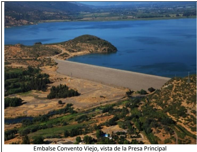
Embalse Convento Viejo, vista de la Presa Principal