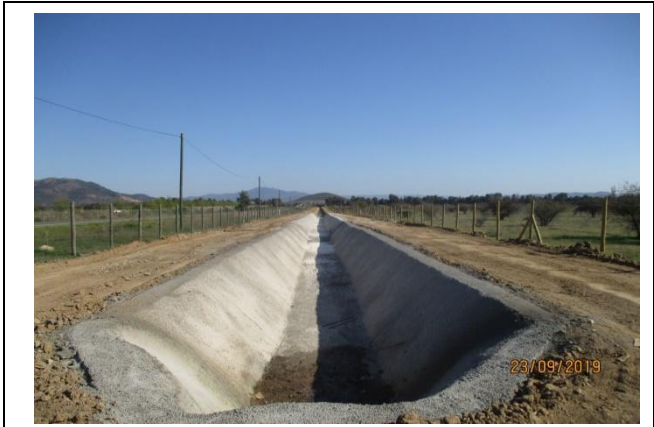
NCS; ramal “El Molino 1”; revestimiento canal (km 0,640 – km 1,060)