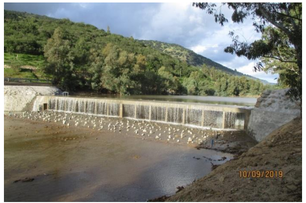
Poza Quiahue N° 1 de ramal “El Fondo”; vista general.