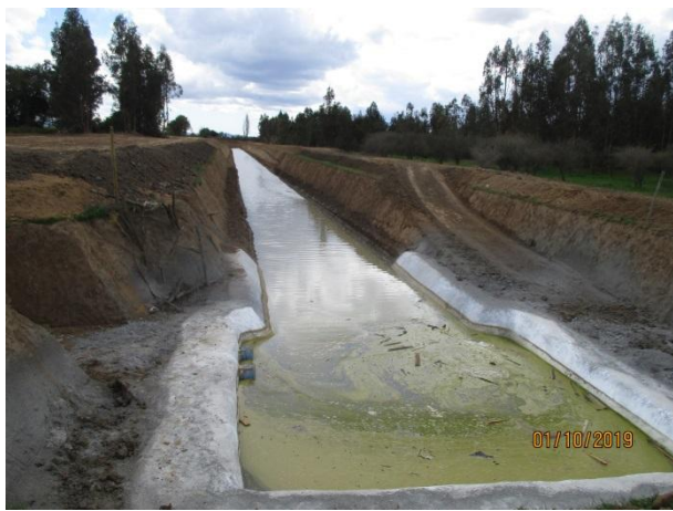
NCS; ramal "El Molino 2.1 A"; sentina terminal del canal. Punto de extracción por bombeo y de forma gravitacional (tubos a la derecha). En la fotografía en una prueba hidráulica.