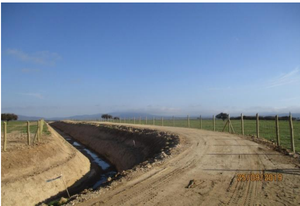
NCS; ramal "El Molino 2.1"; canal en tierra (km 1,250 – km 3,400)