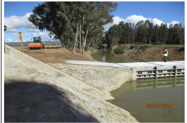
Poza Quiahue N° 2 de ramal “El Molino”; vista general