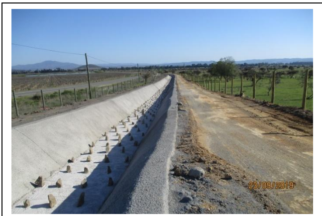
NCS; ramal “El Molino 1”; disipadores “tresbolillo” en fondo canal (km 0,310 –km 0,64)