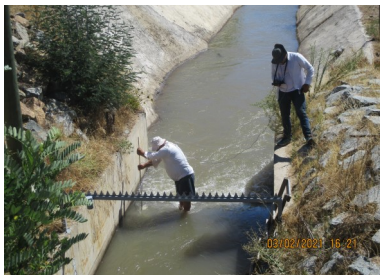
Inspección de aforos de la SCECV 03/02/2021, Estación Canal Lolol en Bocatoma. Caudal aforado: 0,496 m3/s .

El sismo regional más intenso fue el del 24 de febrero con magnitud de 3,7 MI GUC a 28 Km al O de Navidad.