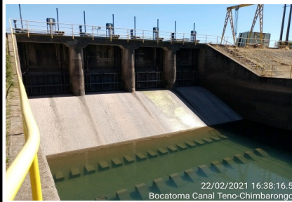
22/02/2021 16:38:16.5 Bocatoma Canal Teno-Chimbarongo

El proceso de licitación a que fue sometido el Proyecto, fue adjudicado por Decreto Supremo N° 273, del 27 de abril de 2005 (publicado en Diario Oficial del 04 de julio de 2005, al Consorcio conformado por las empresas Belfi-Besalco-Brotec, las cuales constituyeron la Sociedad Concesionaria Embalse Convento Viejo S.A