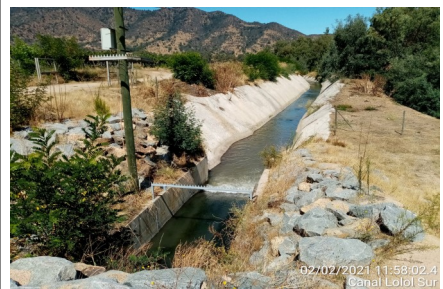
02/02/2021 11:58:02.4 Canal Lolol Sur

Mediante la Resolución (E) N° 1722, de fecha 07 de septiembre de 2020, se materializa la Puesta en Servicio Definitiva de las Fases I, II y III, en virtud de los plazos establecidos mediante Resolución (E) DGC N° 1109, de 23 de noviembre de 2018, y a lo dispuesto en el artículo 1.10.6, de las Bases de Licitación, en concordancia con el artículo 56 del Reglamento de la Ley de Concesiones de Obras Públicas.