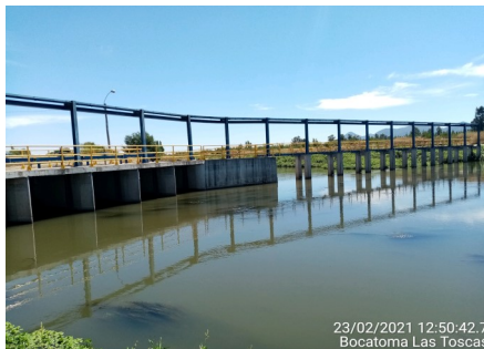
23/02/2021 12:50:42.7 Bocatoma Las Toscas

Fase 2: Obras Complementarias: Corresponde a la modificación y extensión de las redes existentes de conducción de agua, además del Canal Matriz Nilahue que incluye el Túnel La Lajuela.