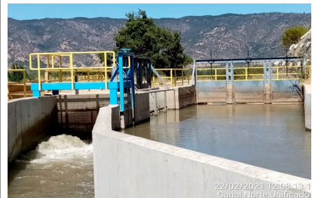
22/02/2021 12:08:13.1 Canal Norte Unificado

Las obras correspondientes a la Fase 3, con la finalidad de estudiar un nuevo trazado, fueron suspendida por Resolución DGOP N° 4607, de fecha 01 de octubre de 2009, y reiniciadas por instrucción contenida en la Resolución DGOP N°262, del 25 de enero de 2013, tramitada el 30 de enero de 2013 y ratificada por Decreto Supremo N°244 del 07 de agosto de 2013 publicado el día 26 de abril de 2014.