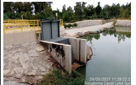
Bocatoma de Sifón Nerquihue y Canal Norte

Mediante la Resolución (E) N° 1722, de fecha 07 de septiembre de 2020, se materializa la Puesta en Servicio Definitiva de las Fases I, II y III, en virtud de los plazos establecidos mediante Resolución (E) DGC N° 1109, de 23 de noviembre de 2018, y a lo dispuesto en el artículo 1.10.6, de las Bases de Licitación, en concordancia con el artículo 56 del Reglamento de la Ley de Concesiones de Obras Públicas.