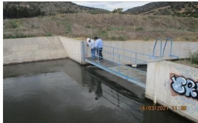
Inspección de aforos de la SCECV 16/03/2021, Estación de medición Descarga a Las Toscas. Caudal aforado: 5,757 m3/s.

Como es habitual, no se registraron daños estructurales ni filtraciones en el período informado ligadas al sismo.