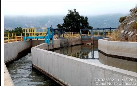
29/03/2021 11:13:26.1 Canal Norte Unificado

Las obras correspondientes a la Fase 3, con la finalidad de estudiar un nuevo trazado, fueron suspendida por Resolución DGOP N° 4607, de fecha 01 de octubre de 2009, y reiniciadas por instrucción contenida en la Resolución DGOP N°262, del 25 de enero de 2013, tramitada el 30 de enero de 2013 y ratificada por Decreto Supremo N°244 del 07 de agosto de 2013 publicado el día 26 de abril de 2014.