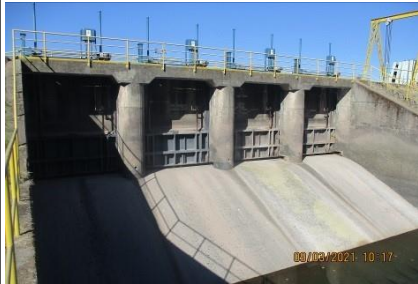
Bocatoma Canal Teno-Chimbarongo

El proceso de licitación a que fue sometido el Proyecto, fue adjudicado por Decreto Supremo N° 273, del 27 de abril de 2005 (publicado en Diario Oficial del 04 de julio de 2005, al Consorcio conformado por las empresas Belfi-Besalco-Brotec, las cuales constituyeron la Sociedad Concesionaria Embalse Convento Viejo S.A