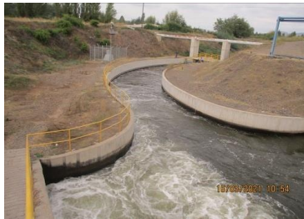
Canal Matriz Nilahue Tramo1 en Bocatoma Uva Blanca.