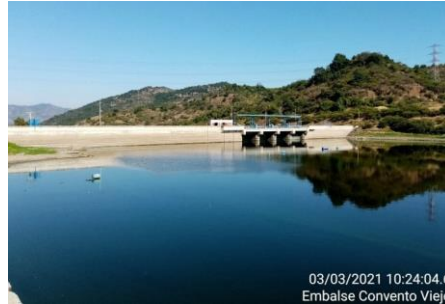
Presa Auxiliar en Embalse Convento Viejo.

Para la construcción del Embalse Convento Viejo el proyecto se desarrolló en tres fases, siendo éstas: Fase 1: Obras del Embalse: Corresponde a las obras de los Muros Principal y Auxiliar, obras de evacuación de crecidas, obras de entrega, obras de modificación de infraestructura entre las que se contaba una Variante Ferroviaria, Línea de Alta Tensión y Oleoducto.