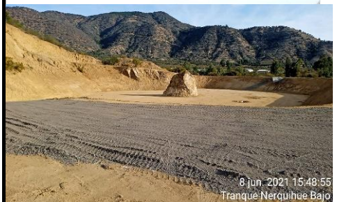
Tranque Nerquihue Bajo

Las obras correspondientes a la Fase 3, con la finalidad de estudiar un nuevo trazado, fueron suspendida por Resolución DGOP N° 4607, de fecha 01 de octubre de 2009, y reiniciadas por instrucción contenida en la Resolución DGOP N°262, del 25 de enero de 2013, tramitada el 30 de enero de 2013 y ratificada por Decreto Supremo N°244 del 07 de agosto de 2013 publicado el día 26 de abril de 2014.