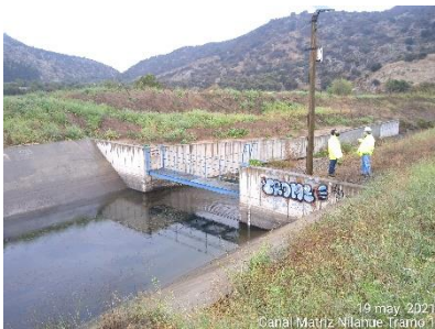
Estación de medición Descarga a Las Toscas en Km 6,225 del Canal Matriz Nilahue Tramo 1.

Como es habitual, no se registraron daños estructurales ni filtraciones en el periodo informado ligadas al sismo.