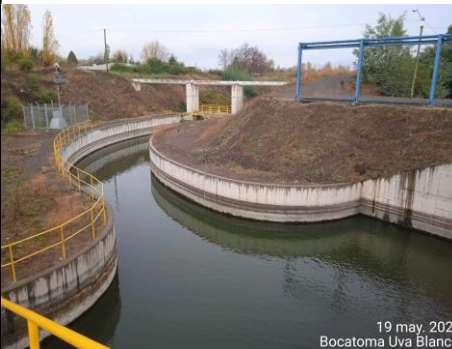
Canal Matriz Nilahue Tramo1 en Bocatoma Uva Blanca.

Fase 2: Obras Complementarias: Corresponde a la modificación y extensión de las redes existentes de conducción de agua, además del Canal Matriz Nilahue que incluye el Túnel La Lajuela.