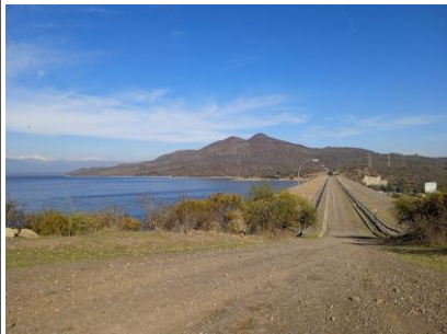
Bocatoma Canal Teno-Chimbarongo

El proceso de licitación a que fue sometido el Proyecto, fue adjudicado por Decreto Supremo N° 273, del 27 de abril de 2005 (publicado en Diario Oficial del 04 de julio de 2005, al Consorcio conformado por las empresas Belfi-Besalco-Brotec, las cuales constituyeron la Sociedad Concesionaria Embalse Convento Viejo S.A