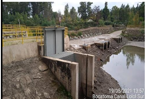
Bocatoma Canal Lolol Sur.

Mediante la Resolución (E) N° 1722, de fecha 07 de septiembre de 2020, se materializa la Puesta en Servicio Definitiva de las Fases I, II y III, en virtud de los plazos establecidos mediante Resolución (E) DGC N° 1109, de 23 de noviembre de 2018, y a lo dispuesto en el artículo 1.10.6, de las Bases de Licitación, en concordancia con el artículo 56 del Reglamento de la Ley de Concesiones de Obras Públicas.