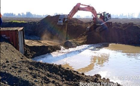
Bocatoma La Patagua-Pataguilla en Estero Las Toscas

Fase 3 Red de Riego: Comprende la Red de Canales Principales y Secundarios, Sifones, Tranques y Bocatomas, que abastecen a parte del Valle de Nilahue.