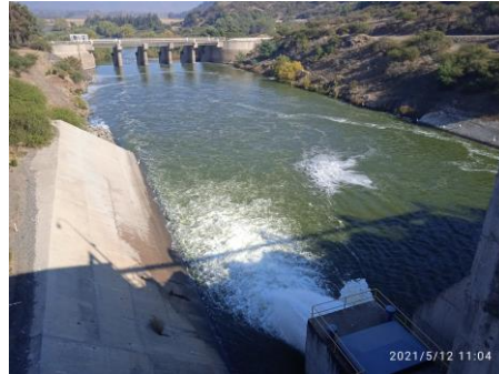
Presas Auxiliar en Embalse Convento Viejo.

Para la construcción del Embalse Convento Viejo el proyecto se desarrolló en tres fases, siendo éstas: Fase 1: Obras del Embalse: Corresponde a las obras de los Muros Principal y Auxiliar, obras de evacuación de crecidas, obras de entrega, obras de modificación de infraestructura entre las que se contaba una Variante Ferroviaria, Línea de Alta Tensión y Oleoducto.