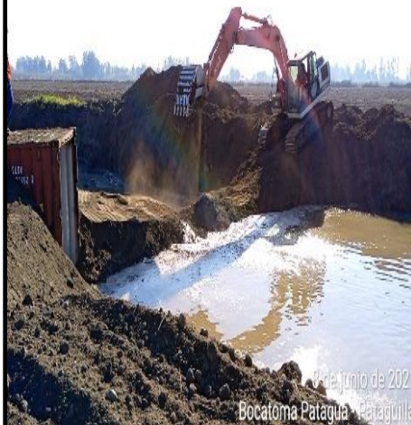
Bocatoma La Patagua-Pataguilla en Estero Las Toscas

A la fecha, tanto las obras de las Fases 1, 2 y 3, se encuentran con sus Puestas de Servicio Provisionarias aprobadas y en operación.