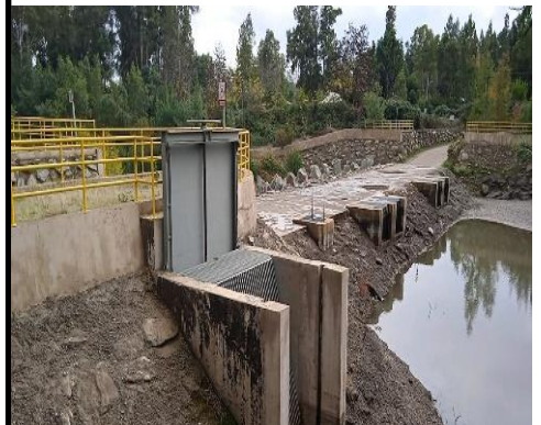
Bocatoma Canal Lolol Sur.

Mediante la Resolución (E) N° 1722, de fecha 07 de septiembre de 2020, se materializa la Puesta en Servicio Definitiva de las Fases I, II y III, en virtud de los plazos establecidos mediante Resolución (E) DGC N° 1109, de 23 de noviembre de 2018, y a lo dispuesto en el artículo 1.10.6, de las Bases de Licitación, en concordancia con el artículo 56 del Reglamento de la Ley de Concesiones de Obras Públicas.