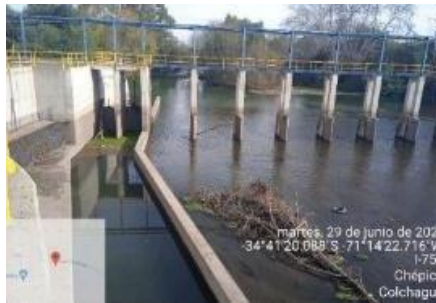
Canal Matriz Nilahue Tramo1 en Bocatoma Uva Blanca.

Fase 2: Obras Complementarias: Corresponde a la modificación y extensión de las redes existentes de conducción de agua, además del Canal Matriz Nilahue que incluye el Túnel La Lajuela.