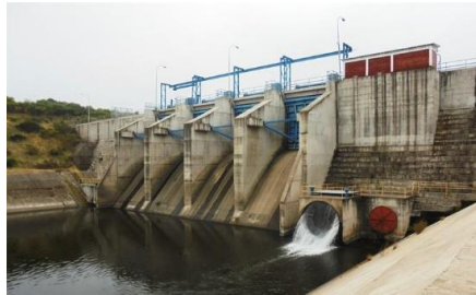
Presa Auxiliar en Embalse Convento Viejo.

Para la construcción del Embalse Convento Viejo el proyecto se desarrolló en tres fases, siendo éstas: Fase 1: Obras del Embalse: Corresponde a las obras de los Muros Principal y Auxiliar, obras de evacuación de crecidas, obras de entrega, obras de modificación de infraestructura entre las que se contaba una Variante Ferroviaria, Línea de Alta Tensión y Oleoducto.