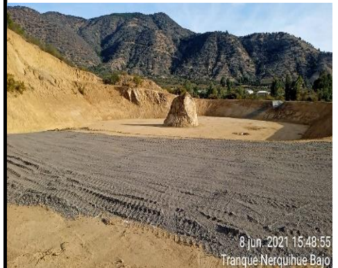
Tranque Nerquihue Bajo

Las obras correspondientes a la Fase 3, con la finalidad de estudiar un nuevo trazado, fueron suspendida por Resolución DGOP N.º 4607, de fecha 01 de octubre de 2009, y reiniciadas por instrucción contenida en la Resolución DGOP N°262, del 25 de enero de 2013, tramitada el 30 de enero de 2013 y ratificada por Decreto Supremo N°244 del 07 de agosto de 2013 publicado el día 26 de abril de 2014.