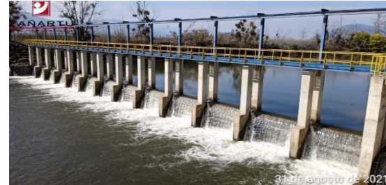
Bocatoma Uva Blanca.

El proyecto citado se enmarca en el plan de desarrollo de áreas de riego propuesto para el Embalse Convento Viejo, que tiene por objeto utilizar la disponibilidad de agua del Embalse Convento Viejo, para ampliar el área de riego, a través del mejoramiento de cauces naturales, el mejoramiento de canales existentes y la construcción de otras obras que permitan llevar el agua hasta la comuna de Marchigüe y el Valle de Nilahue.