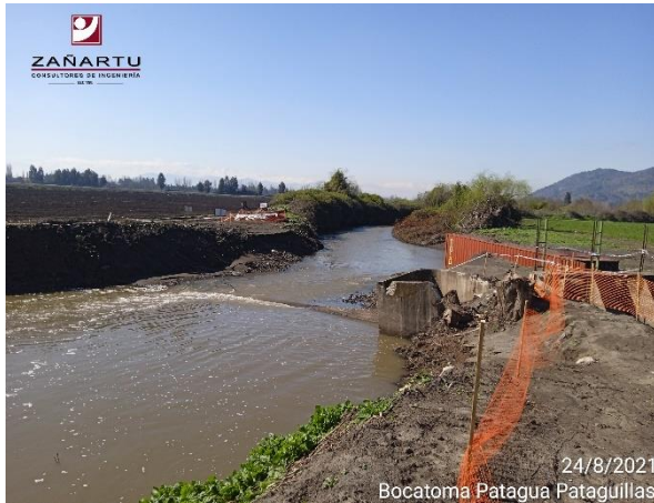
Patagua - Patagüilla.

En 2021, solo hay aprobación para Obras del sector de Nerquihue Bajo y La Cabaña.