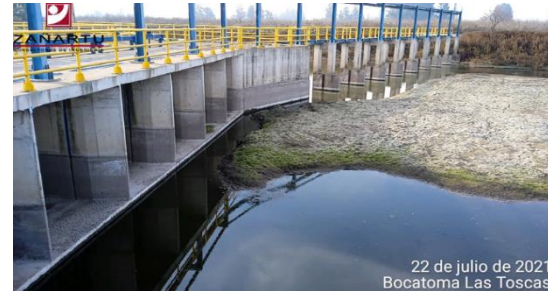
Bocatoma Las Toscas.

El proyecto citado se enmarca en el plan de desarrollo de áreas de riego propuesto para el Embalse Convento Viejo, que tiene por objeto utilizar la disponibilidad de agua del Embalse Convento Viejo, para ampliar el área de riego, a través del mejoramiento de cauces naturales, el mejoramiento de canales existentes y la construcción de otras obras que permitan llevar el agua hasta la comuna de Marchigüe y el Valle de Nilahue.