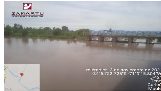
Bocatoma canal Teno-Chimbarongo.

El proyecto citado se enmarca en el plan de desarrollo de áreas de riego propuesto para el Embalse Convento Viejo, que tiene por objeto utilizar la disponibilidad de agua del Embalse Convento Viejo, para ampliar el área de riego, a través del mejoramiento de cauces naturales, el mejoramiento de canales existentes y la construcción de otras obras que permitan llevar el agua hasta la comuna de Marchigüe y el Valle de Nilahue.