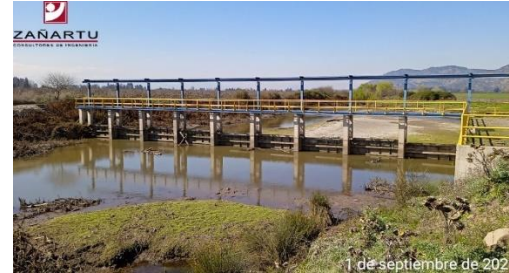
Bocatoma Las Toscas.

El proyecto citado se enmarca en el plan de desarrollo de áreas de riego propuesto para el Embalse Convento Viejo, que tiene por objeto utilizar la disponibilidad de agua del Embalse Convento Viejo, para ampliar el área de riego, a través del mejoramiento de cauces naturales, el mejoramiento de canales existentes y la construcción de otras obras que permitan distribuir el agua hasta la comuna de Marchigüe y el Valle de Nilahue.