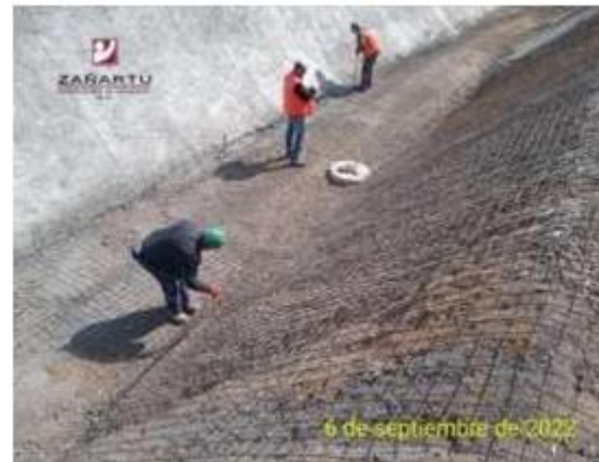
Canal Norte Km 11+760 Instalación de malla ACMA, previos trabajos de shotcrete.

En este cuadro se muestra la evolución de los ingresos de la Sociedad Concesionaria, los últimos seis meses, en relación a la venta de aguas y a la generación de energía eléctrica, cabe señalar que dichos ingresos no necesariamente corresponden con la venta de aguas o generación eléctrica de los meses en cuestión, también se incluyen ingresos por cobros de servicios prestados en períodos anteriores.