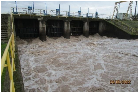
Bocatoma canal Teno-Chimbarongo.

Se miden los caudales de entrada al embalse, y se revisa el balance hidrológico que elabora diariamente la Sociedad Concesionaria, cuantificando los volúmenes de almacenamiento del embalse y verificando que se disponga para la temporada de riego de los volúmenes de agua que permitan cumplir con los contratos que suscribe la Sociedad Concesionaria con los regantes del Valle de Chimbarongo y otros clientes.