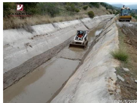
Canal Norte Unificado entre km. 11+600 y 11+980. Limpieza de Canales

Desde mayo a agosto se realiza limpieza, mantención y/o reparación en la red de riego, con el fin de iniciar la temporada sin inconvenientes.