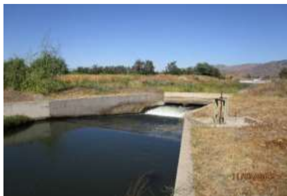
Canal Matriz Nilahue Tramo 1 en km 4+800.

Las encuestas que se estaban realizando fueron detenidas porque algunos dirigentes manifestaron que los datos podrían ser usados con otros fines, se acordó reunión con alcalde, Dirigentes, MDSF, Concesiones y SC para resolver el problema y acordar como continuar.