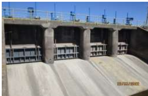
Bocatoma canal Teno-Chimbarongo.

Se miden los caudales de entrada al embalse, y se revisa el balance hidrológico que elabora diariamente la Sociedad Concesionaria, cuantificando los volúmenes de almacenamiento del embalse y verificando que se disponga para la temporada de riego de los volúmenes de agua que permitan cumplir con los contratos que suscribe la Sociedad Concesionaria con los regantes del Valle de Chimbarongo y otros clientes.