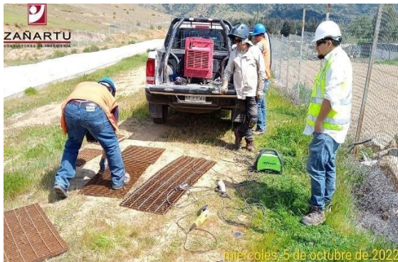
Canal Sur Km 8+500. Avance de mejoramiento rejilla de seguridad de cámara de descarga hacia quebrada.

Se realizaron reuniones en las oficinas del MOP en Santiago para coordinar labores a desarrollar hasta final de año con el fin de conseguir la evaluación social y autorizaciones de la CNR y DOH. Resultados que serán respaldados por las encuestas realizadas en el sector.