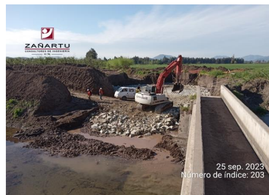
Canal Matriz Nilahue 1, Km 2+630.