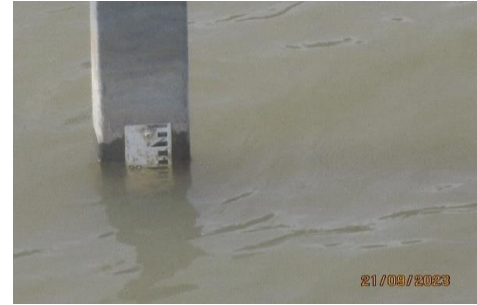
Fecha 21/09/2023, 10:20 h. Altura limnimétrica: 0,91 m. Caudal: 36,602 m 3 /s.

Estación de medición Tipo 1 Estación Lo Toro.