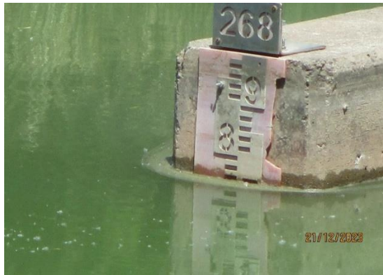
Fecha 21/12/2023, 10:40 h. Cota: 267,64 Volumen 229.531.842 m3.

Lectura de Nivel en Embalse Convento Viejo.