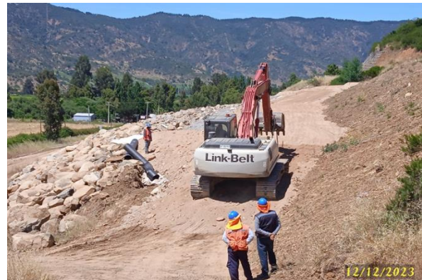
Canal Norte unificado, Km 12+005.

Rio Teno, continúan los trabajos de reconstrucción de los pretilos de defensa de la ribera norte. En el intertanto la Concesionaria se ha reunido con representantes de la DOH.