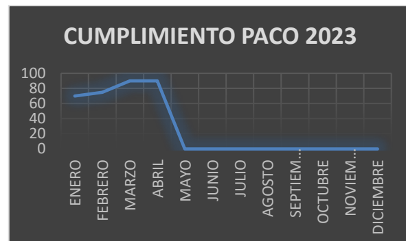
Gráfico de cumplimiento del PACO 2023, correspondiente al mes de abril 2023.

Al 30 de abril del 2023 el embalse registra un volumen de 97.883.632 m 3 , con una cota de 261,830 msnm. Que corresponde a un 41,27% de la capacidad del embalse.