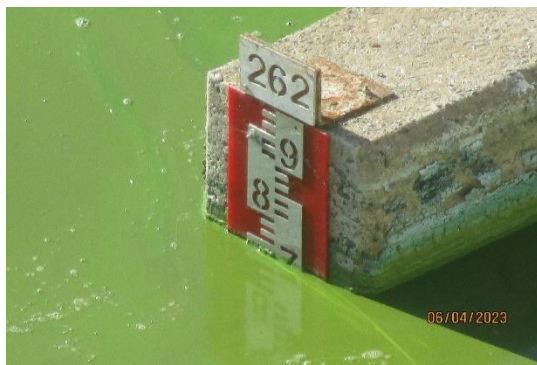
Fecha 06/04/2023,11:35 h. Cota: 261.720 Volumen 96.279.775.

Lectura de Nivel en Embalse Convento Viejo.