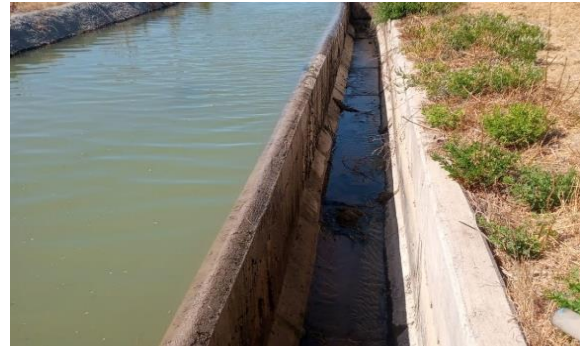
Canal Lolol Sur, limpieza vertedero 2.1.

Desde mayo a la fecha se realiza limpieza, mantención y/o reparación en la red de riego, con el fin de mantener la temporada sin inconvenientes.